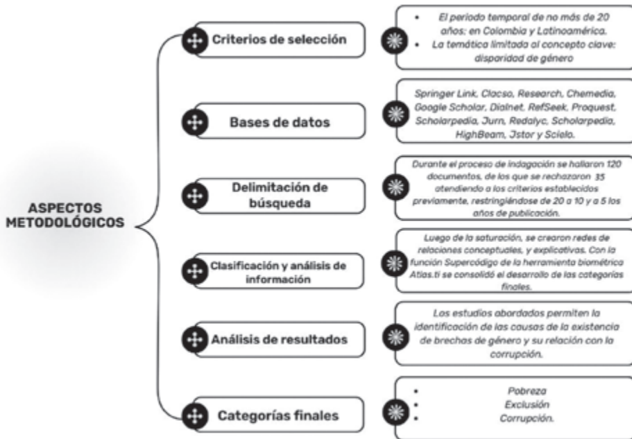
Figura 1. Aspectos metodológicos

La siguiente figura resume los aspectos clave de la metodología.