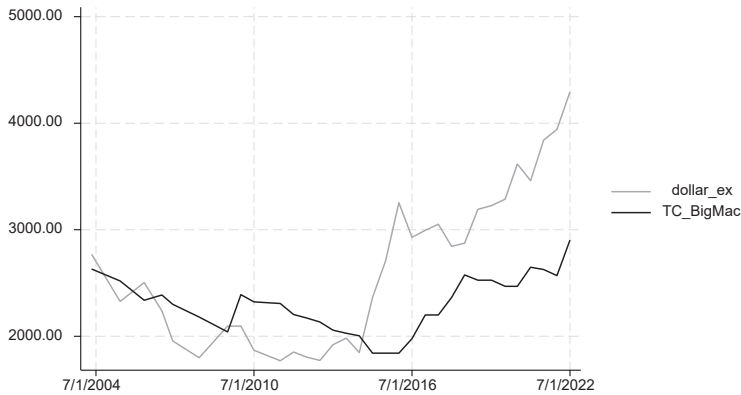
Gráfica 2. Tasa Big Mac de paridad para Colombia y tasa de cambio peso/dólar: 2004-2022

Fuente: elaboración propia a partir de información de The Economist .