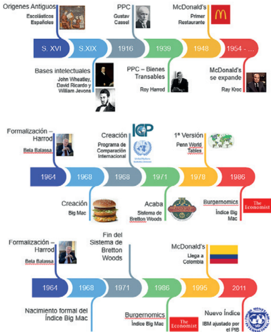
Figura 1. Evolución histórica del índice Big Mac