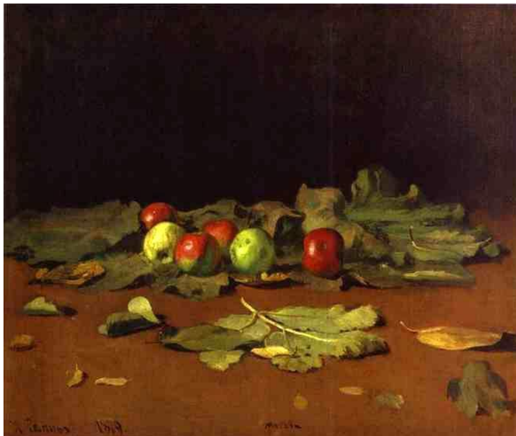
Obra: Manzanas y hojas ,1879