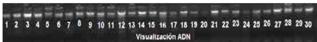
Fig 1. Visualización del ADN extraído de las accesiones en estudio, en gel de agarosa al 1 % (p/v) teñido con bromuro de etidio.

En cuanto a la calidad, basada en el grado de absorbancia (260nm/280nm), presentó valores de 2.00, lo cual indica una buena calidad del ADN extraído (19). Con respecto a la cantidad, se obtuvieron concentraciones con rango entre 481.9 (2517) y 6.942 (2138) ng/ \mu l (datos no mostrados).