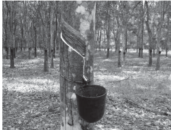
Sistema de sangría en caucho.