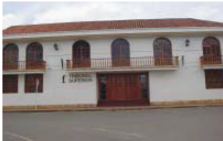
Tribunal Superior de Santa Rosa de Viterbo

5.1.1.1 Antecedentes. Siendo presidente, el doctor José Ignacio de Márquez expidió el decreto 740 de febrero de 1832, que ordena, en el artículo 5.º, que en Santa Rosa de Viterbo residiera un Tribunal, en virtud de la amplia geografía y teniendo en cuenta la importancia de los asentamientos humanos y polos de desarrollo en ese momento. Mediante la ley 1128 del 14 de febrero 2007, el Congreso de la República declaró a esta H. Corporación patrimonio histórico y cultural de la nación.