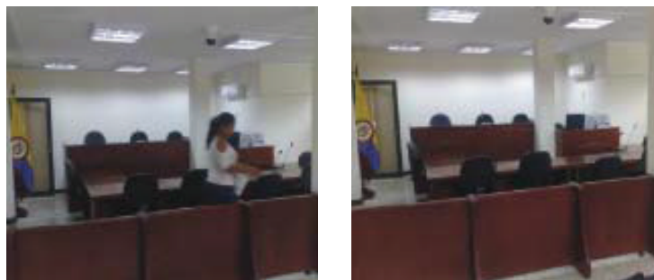
Sala de audiencias Palacio de Justicia de Yopal

6.1.1.4 Sistema Penal Acusatorio. En este Distrito Judicial, el Sistema Penal Acusatorio empezó a regir el 1 de enero de 2008, para lo cual la Sala Administrativa del Consejo Superior de la Judicatura, por Acuerdo N.º PSAA08-4424 de 2008, una vez agotados los trámites ante la Comisión Interinstitucional de la Rama Judicial, de conformidad con lo establecido en la ley 270 de 1996, amplió la planta de personal, creando un Juzgado Promiscuo Municipal en cada uno de los circuitos (Yopal, Monterrey, Orocué y Paz de Ariporo), así como el Juzgado Tercero Penal del Circuito en Yopal, el Juzgado de Ejecución de Penas y Medidas de Seguridad para la misma ciudad y un Centro de Servicios Judiciales para atender exclusivamente la oralidad en el Sistema Penal en la ciudad capital; en total se crearon 26 cargos, que han permitido el desarrollo adecuado, haciendo alusión al principio de celeridad que caracteriza este sistema. La oralidad caracteriza al sistema Penal Acusatorio y permite acercar la justicia a la comunidad.