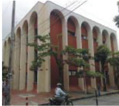
Palacio de Justicia de Yopal