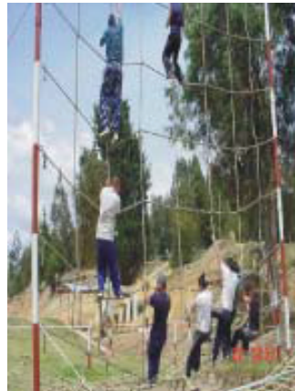
Soldado por un día. En verdad que resulta llamativa la participación de servidores judiciales en una actividad de esta naturaleza

La Brigada de emergencia fue capacitada en primeros auxilios, manejo de extintores y atención de emergencias, a través de la preparación para simulacro de evacuación; las actividades se realizaron con el apoyo de Suratep y el Comité Regional para la Atención y Prevención de Desastres de la Gobernación de Boyacá. Así mismo, la Brigada de emergencias de Tunja participó con una delegación de 4 líderes brigadistas en el Primer Encuentro Nacional de Brigadistas, realizado en Tabio, Cundinamarca.