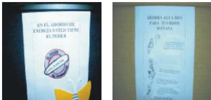
Reciclar sí paga

Resulta de gran importancia para la Sala Administrativa del Consejo Seccional de la Judicatura y la Dirección Ejecutiva Seccional, promover el ahorro de agua y energía, y el reciclaje, como partes fundamentales del ambiente y de la calidad de vida, tanto de la presente generación como de las futuras. Para esto se dictaron conferencias a los servidores judiciales, con un alto número de participantes; de igual forma, se publicaron afiches y boletines persuasivos en carteleras, pasillos y baños, invitando a los servidores judiciales al buen uso de los servicios públicos y a la cultura del autocontrol. Con los recursos obtenidos del reciclaje se atendieron necesidades urgentes de algunos despachos en materia de salud ocupacional y bienestar social.