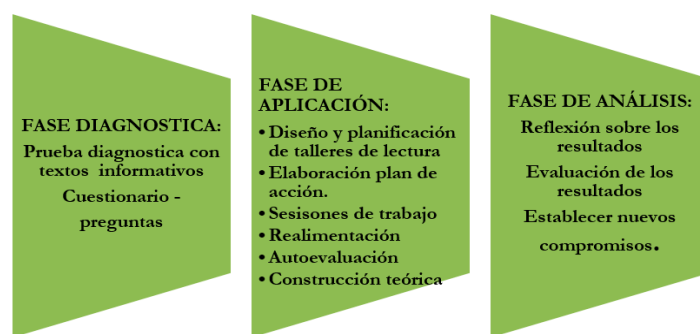
Figura 2. Fases de la investigación.

Se debe entender la I-A como una indagación realizada por el docente investigador para mejorar su práctica pedagógica, a través de la aplicación de estrategias pedagógicas o acciones que ayuden a solucionar deficiencias o problemas en el orden educativo. Para dar respuesta a los objetivos de la investigación se plantean las siguientes fases: