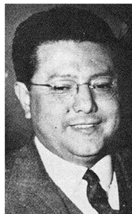
Fotografía 12. Lucio Pabón Núñez.

De acuerdo con el Acta de instalación del Honorable Consejo Directivo de la Universidad Pedagógica de Colombia, correspondiente a la sesión del 22 de diciembre de 1953, dos nombramientos fueron aprobados por el Consejo; en primer lugar, y en condición de titular,