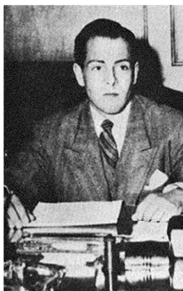
Fotografía 11. Aurelio Caicedo Ayerbe.