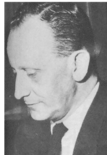
Fotografía 15. José Manuel Rivas Sacconi. Fuente: Página WEB. Ministros de Educación Nacional de Colombia.