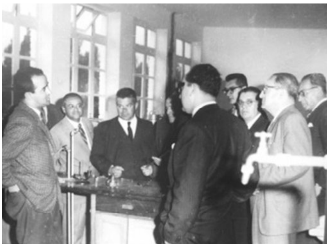
Fotografía 8. Profesores de la Universidad Pedagógica de Colombia en reunión con delegados del Ministerio de Educación Nacional.