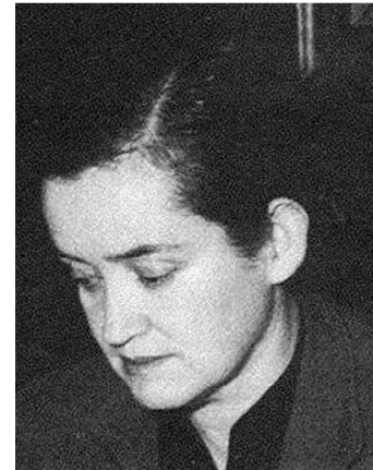
Fotografía 14. Josefina Valencia de Hubach. Fuente: Página WEB. Ministros de Educación Nacional de Colombia.