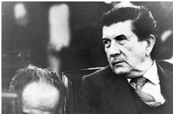
Fotografía 21. Raimundo Emiliani Román. Conservador-cartagenero. Senador por cerca de 20 años. 1914-2005.

Terminadas las negociaciones entre el Gobierno, empleadores y trabajadores en la Comisión tripartita, el Gobierno expidió el Decreto 118 del 21 de junio de 1957, “por el cual se decreta aumento de salarios, se establece el subsidio familiar y se crea el Servicio Nacional de Aprendizaje –SENA–” 37 . El primer director del naciente SENA, por