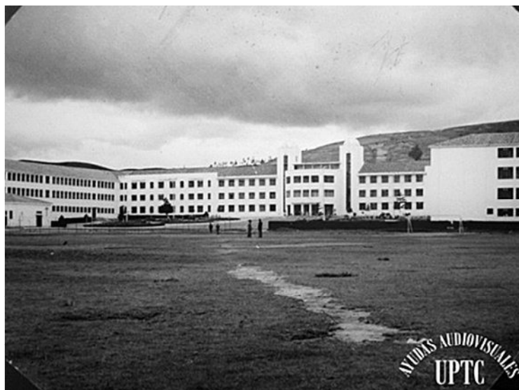
Fotografía 2. Vista panorámica de la Universidad en Tunja, antes de 1959.