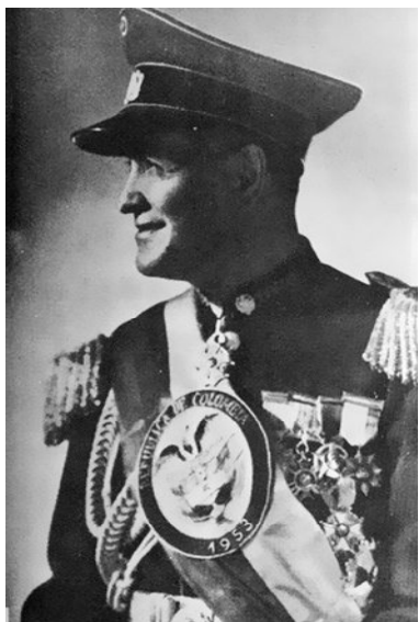
Fotografía 1. Teniente general Gustavo Rojas Pinilla.