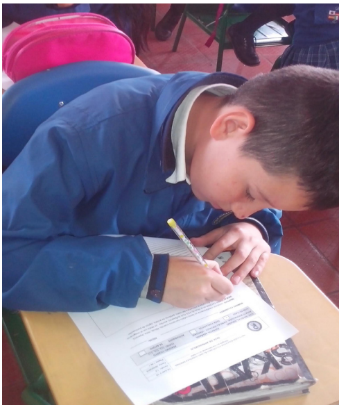
Figura 2. Desarrollo de talleres de producción escrita.