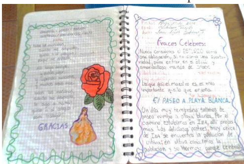
Figura 3. Estrategia cuaderno viajero.

Como se puede observar, es un proceso que se va desarrollando y el niño va creando conciencia de la importancia