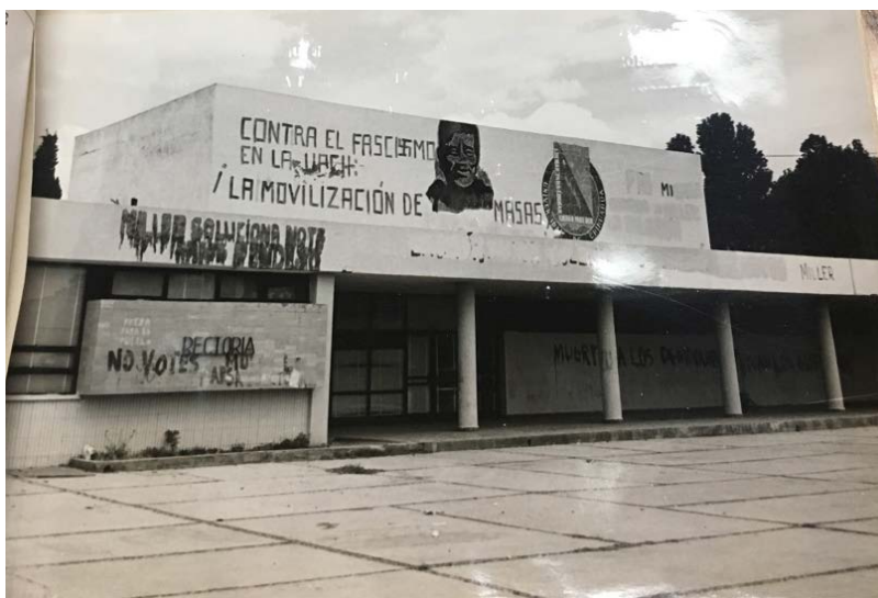
Imagen 1. Entrada principal de la Escuela Preparatoria de la UACH vandalizada por los estudiantes.