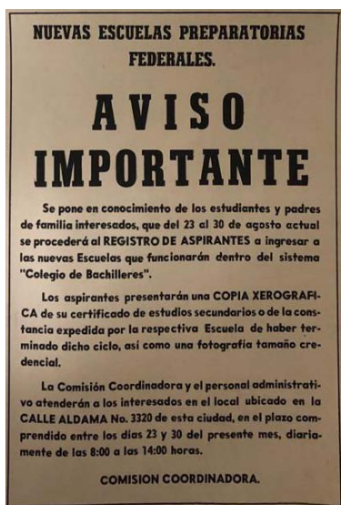
Imagen 3. Anuncio de la convocatoria para la recepción de documentación del Colegio de Bachilleres.