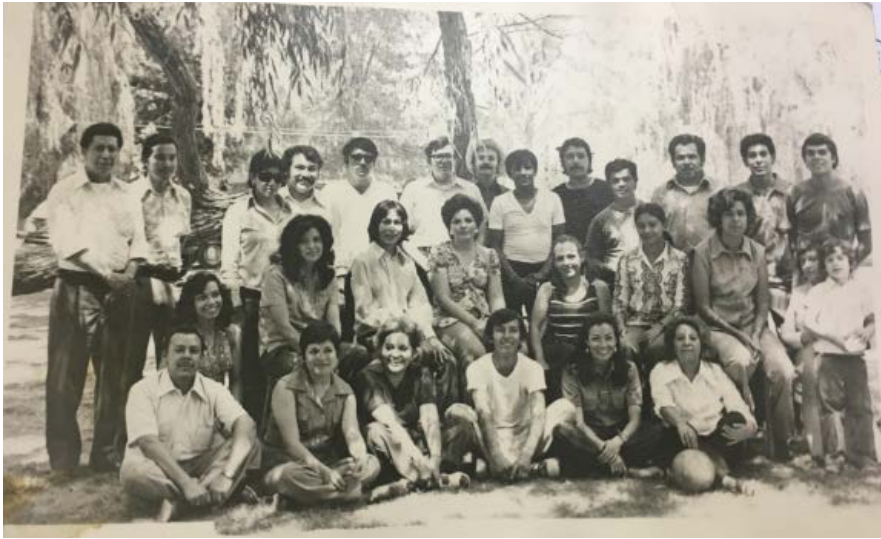
Imagen 6. Maestros fundadores del Plantel 3, turno vespertino