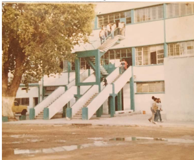
Imagen 5. Instalaciones del Plantel 1, edificio que anteriormente ocupaba el Instituto Regional.