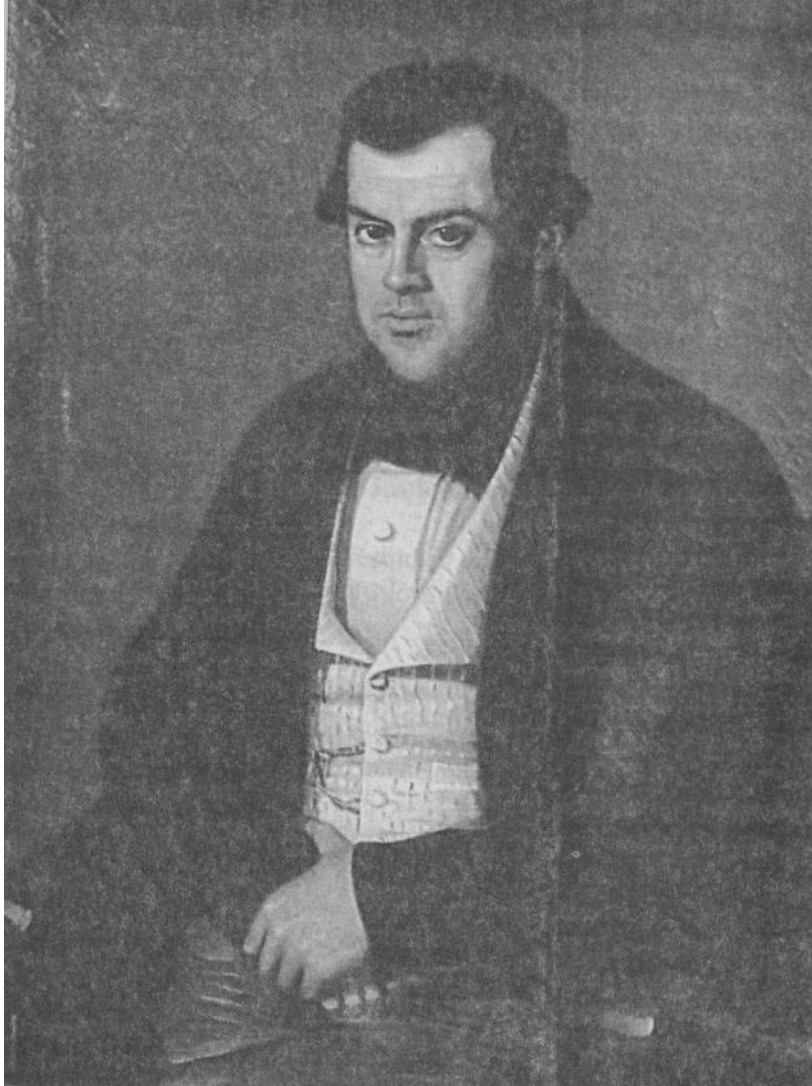
DOMNGO FAUSTINO SARMIENTO (1811-1888)