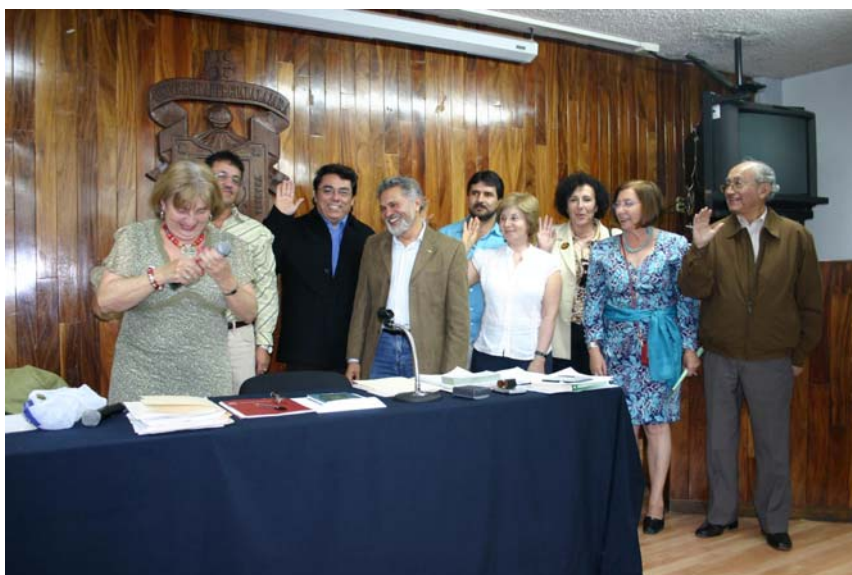
Posesión Nueva Junta de la Sociedad de Historia de la Educación Latinoamericana SHELA, Guadalajara Octubre 2007.

29 al 31 de octubre de 2007 Centro Universitario de Ciencias Sociales y Humanidades (CUCSH) de la Universidad de Guadalajara.