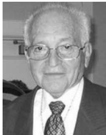
Dr. Orlando Fals Borda

Una de sus grandes preocupaciones fue la investigación sobre la educación y las Ciencias Sociales en los países del Tercer Mundo, ante las dificultades económicas y las influencias de las grandes potencias en los métodos y formas de la investigación científica. Según sus ideas, en Colombia y en general en Latinoamérica existe un colonialismo intelectual , que necesita un cambio para llegar a alcanzar una ciencia propia para los latinoamericanos. Necesitamos que los investigadores piensen en los estudios sobre Colombia y en general sobre América Latina con criterios científicos propios aplicados a nuestra realidad, que son diferentes a las realidades de Europa, Estados Unidos y el Mundo.