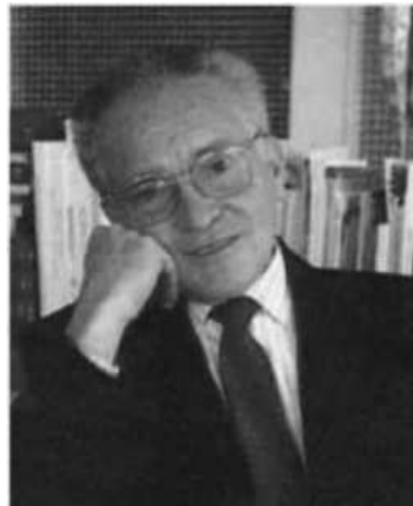
Dr. Orlando Fals Borda