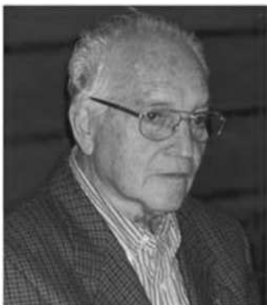
Dr. Orlando Fals Borda

En el Congreso Mundial de Convergencia se hizo un homenaje a los pioneros de la Educación social en el mundo. Entre ellos se dio realce a las ideas del pedagogo brasileño Paulo Freire , quien había sido un invitado especial al Congreso, pero falleció el 2 de mayo de 1997, pocos días antes del certamen. Este ilustre pedagogo, autor de las obras Pedagogía del oprimido , Educación para el cambio social , Pedagogía de la esperanza y muchas otras, buscó transformar la realidad social del Brasil por el camino de la alfabetización, en un mundo de pobreza e injusticia que necesita la socialización para transformar la sociedad. Se busca a través del “método Freire”, que las gentes alcancen la conciencia de su realidad, a través del diálogo y la socialización, con la ayuda de unos y otros, para alcanzar la conciencia sobre la realidad que se vive y su camino de lucha para llegar a la justicia social. Debe ser una alfabetización a través de un