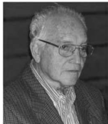
Dr. Orlando Fals Borda