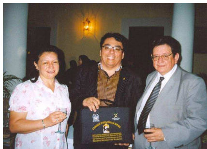
IV Centenario del Santo Cristo de la Grita

El evento organizado por la Rectoría de la Universidad de los Andes, de Rectoría de la Universidad Experimental del Táchira, la Rectoría de la Universidad Católica del Táchira, de la Comisión del Bicentenario de los Movimientos Autonómicos del Estado Táchira (Decreto 405 de 2009 26 de noviembre), del Gobierno del Estado Táchira, de la Dirección de la Educación del Estado Táchira y del Grupo de Historia de la Educación HEDURE se realizó el II CONGRESO INTERNACIONAL DE HISTORIA: Mentalidades, Representaciones e Imaginarios, en la ciudad de San Cristóbal (Venezuela).