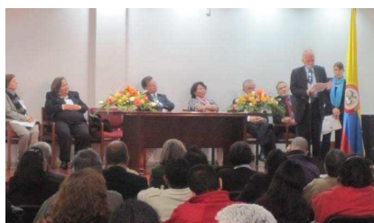
Mesa Directiva IV SEMINARIO TALLER INTERNACIONAL VENDIMIA “Construcción de la Nación: La Universidad del futuro en Iberoamérica”

Tunja, Villa de Leyva – Boyacá, 10-12 noviembre de 2010