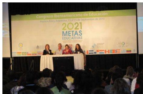
Congreso iberoamericano de educación. Metas 2021. La educación que queremos para la generación de los bicentenarios

Buenos Aires – Argentina, los días 13 al 15 septiembre de 2010