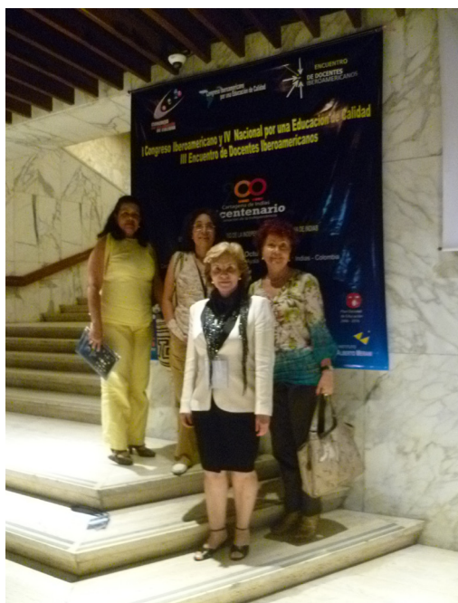
Participantes de RUDECOLOMBIA I congreso iberoamericano y IV Nacional por una educación de calidad III encuentro de docentes iberoamericanos