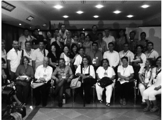
Asistentes II congreso internacional de educación. 15 años RUDECOLOMBIA. Vendimia V

cronogramas de los invitados internacionales, alojamientos y actividades en Santa Marta. Se realizaron reuniones con el Comité Coordinador, el 20 de mayo y 1 de agosto del 2011, donde se entregó en físico el presupuesto de VENDIMIA y el del Evento de los 10 años de RUDECOLOMBIA. Igualmente, se informó por escrito la experiencia de los cuatro eventos de VENDIMIA. Se trabajó con la persona contratada en la elaboración del video institucional, álbum digital y exposición fotográfica.