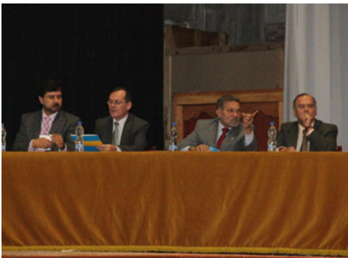
Mesa directiva VIII congreso internacional de la Sociedad de Historia de la Educación Latinoamericana

sociales y su complejidad en los tiempos, los docentes y los desafíos educativos y comunicación matemática y Tics; Textos escolares. Este último simposio recogió los resultados de la investigación titulada “La Independencia americana: textos, enseñanza e imaginarios escolares en Colombia y España”. Se destaca el Panel sobre “Género y Universidad” con participantes de Argentina, Cuba, España, México y Colombia.