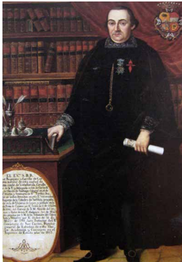
Imagen 2. José Baquijano y Carrillo (1751-1817)

Fuente: “La Independencia del Perú: Plataforma interactiva”. https://independenciaperu.bicentenario.gob.pe/capitulo.php?chapter=2