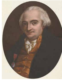
Imagen 3. Pablo de Olavide y Jáuregui (1725-1803)

Fuente: Pablo de Olavide. Retrato anónimo. Museo de La Carolina. Wikipedia, La enciclopedia libre . < https://es.wikipedia.org/w/index.php?title=Pablo_de_Olavide&oldid=157958557 >