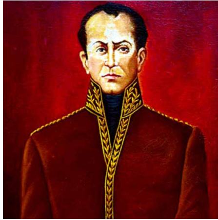
Imagen 5. José Faustino Sánchez Carrión (1787-1825)

Fuente: https://unjfsc.edu.pe/team/jose-faustino-sanchez-carrion/