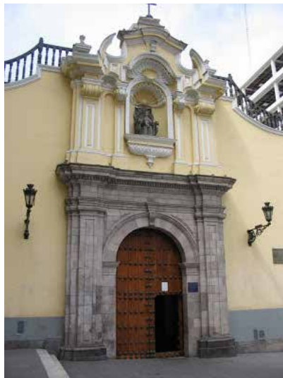
Imagen 1. Fachada del Colegio de San Pablo