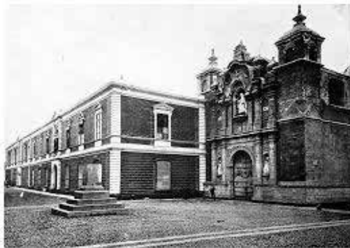
Imagen 4. Fachada principal de la Casona de San Marcos en el centro de Lima, a finales del siglo XIX.