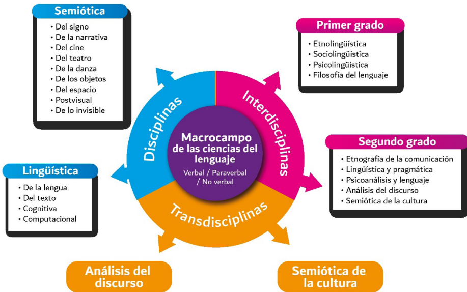
Figura 1. Macrocampo ciencias del lenguaje

En este modelo operativo se destacan los dos campos disciplinarios fundantes en las ciencias del lenguaje, la lingüística y la semiótica, en los cuales los movimientos cualitativos son el paso del signo al texto/discurso, y también el paso de la palabra a lo visual, posvisual, lo invisible, sin dejar de mencionar los desarrollos de la producción semiótico-digital tan importante en los escenarios contemporáneos. En la década de los sesenta, ya con un buen desarrollo disciplinario, las limitaciones empiezan a surgir. En los procesos cognitivos aparece la interdisciplinariedad, que genera múltiples polémicas que no podemos exponer en este trabajo, y los desarrollos de esta perspectiva epistemológica se materializan en dos momentos: el primer grado, cuando se relacionan dos disciplinas, y el segundo grado, cuando se relacionan más de dos disciplinas, o son más complejas las relaciones.