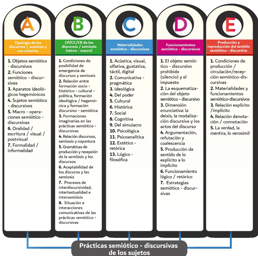
Figura 2. Modelo operativo transdisciplinario

El segundo modelo operativo transdisciplinario fue construido en la tesis de doctorado titulada Debate CEU-Rectoría. Torbellino pasional de los argumentos 9 , que exponemos a continuación.