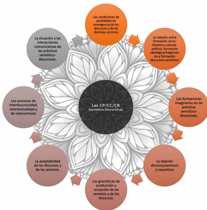
Figura 4. Las CP/CC/CR semiótico-discursivas

Desglosando la Figura 4, enumeramos las propuestas: