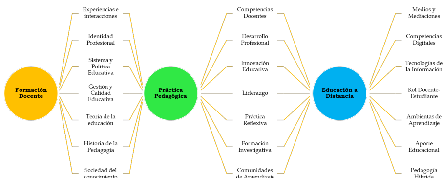
Figura 4. Interconexión de palabras claves

Nota: la Figura 4 se organizó y estructuró a partir de las palabras clave contempladas en el corpus documental, resaltando las de mayor impacto e interacción entre las tres categorías centrales.