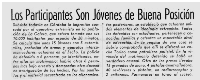
Imagen 2. Copete del periódico La Voz del Interior de la fecha abajo indicada. Título