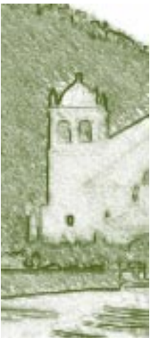
Sede Central de la Universidad Andina Simón Bolívar. Sucre, Bolivia. Detalle.