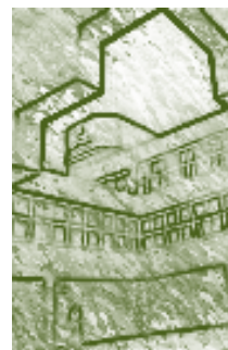
Universidad Santa Cruz de la Sierra.

Por los antecedentes históricos expuestos, se concluye que la Universidad boliviana tiene una tradición que data de la época colonial y que se ha mantenido en la estructura interna de muchas de sus universidades, pese a los numerosos y exitosos procesos de evaluación de la calidad, que han posibilitado la mejora de su formación profesional, a partir de 1997.