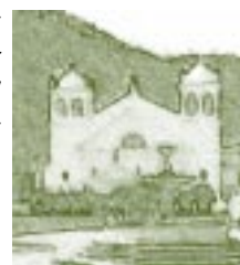
Sede Central de la Universidad Andina Simón Bolívar. Sucre, Bolivia. Detalle.

ción de sus recursos, el nombramiento de sus rectores, personal docente y administrativo, la facción de sus estatutos y planes de estudio, la aprobación de sus presupuestos anuales, la aceptación de legados y donaciones, la celebración de contratos y obligaciones para realizar sus fines y sostener y perfeccionar sus institutos y facultades. Podrán negociar empréstitos con garantía de sus bienes y recursos, previa aprobación legislativa”.