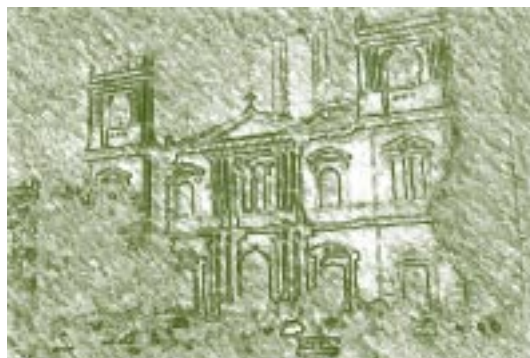
Catedral de Bolivia en la Paz.

En orden de aparición, se detallan las siguientes apariciones de Casas de Estudios Superiores.