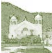
Sede Central de la Universidad Andina Simón Bolívar.

El Departamento de Chuquisaca, lugar de poderío económico y sede de la alta sociedad y de la intelectualidad de la época tiene como capital la ciudad de Sucre, lugar donde se ubicaba el Colegio San Juan Bautista que marcó el hito a partir del cual, en Charcas (otra denominación de la ciudad de Sucre) se creó la primera Universidad boliviana, con el respaldo de las universidades europeas, con cuyas normas comenzó su funcionamiento.