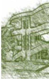
Universidad Autónoma Gabriel Rene Moreno. Detalle.

puesto por “dos profesores de instrucción secundaria”, elegidos por el Cancelario, dos abogados de nota, nombrados por el gobierno; y un delegado del Concejo Municipal, cuerpo colegiado que, a partir de entonces, se constituyó en el CONSEJO UNIVERSITARIO, presidido por el Cancelario.