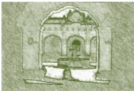
Universidad de San Carlos, Guatemala.

En términos generales, nuestro proceso histórico deriva de un ancestro indígena y en lo político-cultural tres siglos en la categoría de colonia española. Es así, como iniciamos el siglo XIX con la ruptura causada por la independencia y marcada por el mestizaje cultural (indígena, africano y español) para formar unos Estados nacionales con la ambición de establecer gobiernos republicanos. En la búsqueda de la nueva institucionalidad, la universidad colonial trató de ser reformada con la orientación de cada partido político al vaivén de las guerras civiles. Sin embargo, en el siglo XX la preocupación se centró en los niveles de la primaria y la secundaria de tal manera que tan sólo en los años ochenta se reinician los procesos de reforma universitaria. Estas reformas se caracterizan por la influencia del mundo occidental donde se comparten costumbres y valores con la dependencia económica.