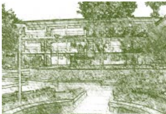
Universidad de San Cristóbal de Huamanga, Perú.

Pero por otra parte, el Banco Mundial, en la citada reunión de la UNESCO de 1998, señalaba lo que se ha denominado las “políticas neoliberales”, donde la “eficiencia educativa se da por indicadores económicos que se reduce a menores costos” 10 .