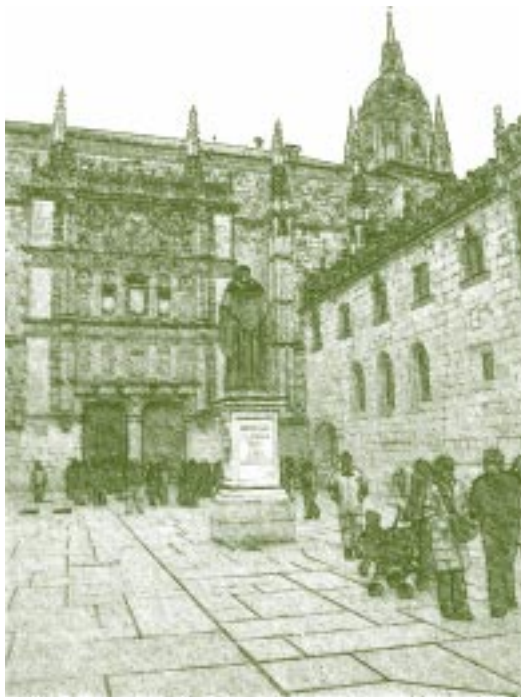
Universidad de Salamanca. Plaza Central

sociedad concreta, con un estilo de vida y una idiosincrasia propia. Por ejemplo, la utilización informática, en concreto el Internet, varía en las regiones de cada país. Universia finalizó un estudio en julio del 2005 en Colombia sobre “Hábitos y usos del Internet” y encontró que en Bogotá, la capital, el 44% de los estudiantes y el 84% de los profesores utilizan diariamente el Internet. Igualmente, el 54% de los estudiantes y el 73% de los profesores tienen Internet en su casa. Pero, a dos horas en bus de la capital se localiza la ciudad de Tunja, donde la utilización del Internet no llega al 20%. Por lo tanto, la calidad de la Educación en América Latina y el Caribe presenta factores exógenos y endógenos. La Declaración de Quito, suscrita entre los Ministros de Educación de América Latina y el Caribe, en abril de 1981, se reconoció el valor de dar calidad a la educación como punto central para la “equidad y la democracia”. Sin embargo, en esta Conferencia eran conscientes que se “había agotado las posibilidades de armonizar cantidad con calidad” y por lo tanto era necesario “producir una transformación de la gestión educativa tradicional que permitiera articular la educación con las demandas sociales, económicas, políticas y culturales” 35 .