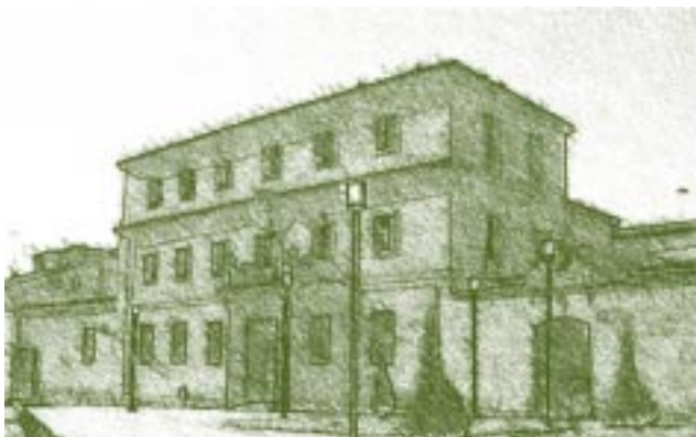
Universidad de Salamanca. Edificio de la Merced.

En definitiva, dentro de las estrategias que se han establecido desde la universidad para hacerle frente a la globalización y demandas científico-tecnológicas-sociales para el siglo XXI, se encuentran: