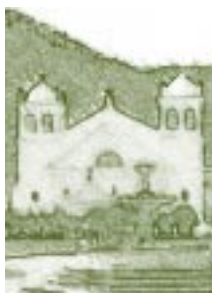
Sede Central de la Universidad Andina Simón Bolívar. Sucre, Bolivia. Detalle.