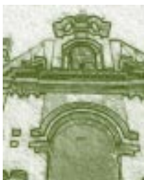
Plaza de Armas. Universidad Nacional de Trujillo. Perú. Detalle.

En definitiva, el resultado de esta política en su aplicación en América Latina se ha concretado en: