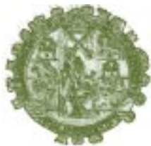
Escudo. Universidad de Salamanca.