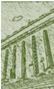
Facultad de Ingeniería. Universidad de Buenos Aires. Argentina. Detalle.