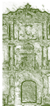
Universidad de Alcalá de Henares