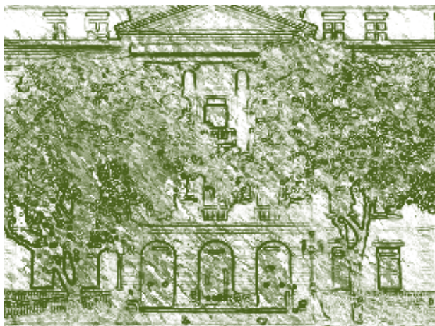
Antigua Escuela de Ingeniería. Universidad Federal de Río de Janeiro. Brasil.

5. La calidad educativa de la educación superior en la “sociedad del conocimiento” del mundo globalizado. Como se ha identificado, la calidad de la educación superior no es problema de un país en particular sino de exigencias de las organizaciones supranacionales. Es evidente, que en la “sociedad del conocimiento” no se puede indicar que un programa académico sea diferente en Brasil o en Argentina. Es más, los sistemas de créditos unifican la labor académica; se leen las mismas revistas dado que es obligatorio, para la acreditación institucional tener programas de base de datos que permitan la lectura informática de revistas y libros especializados. Debe tenerse en cuenta que entre otros programas, el Science Direct o el Scopus que son programas muy costosos para una sola institución educativa. Estamos hablando de cifras como 3.500 millones de dólares. Por lo tanto, la única salida es el trabajo en redes para unificar recursos económicos que ayuden a obtener las bases de datos indispensables en la investigación académica. Este punto es relevante porque a las universidades de América Latina y el Caribe se les mira desde el Banco Mundial y las multinacionales como un mercado lucrativo de compra de programas informáticos. Por supuesto, la calidad no se construye en abstracto. Esta tiene sus características específicas en una