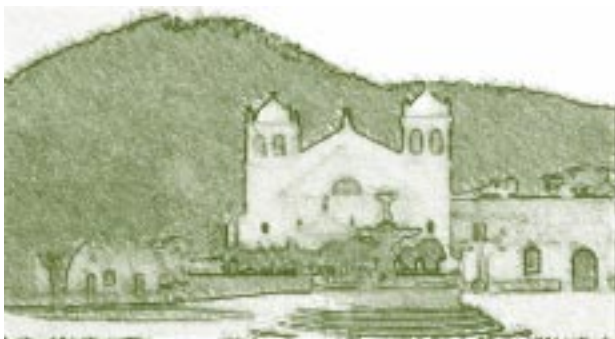
Sede Central de la Universidad Andina Simón Bolívar. Sucre, Bolivia.

Igualmente, al finalizar el siglo XX, en 1999, los ministros de Educación de la Comunidad Andina acordaron en conjunto un "Plan de acción" para ejecutar acciones comunitarias y promover el acceso a una educación de calidad. Sin embargo, esta integración sólo se logra en el 2004 31 cuando se crea, en cooperación con el Convenio Andrés Bello, "El Consejo Andino de Ministros de Educación y responsables de Políticas culturales". Los objetivos se centraron en: cobertura, calidad y pertinencia de la educación superior.