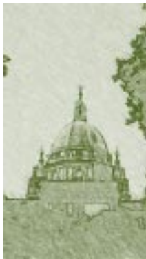
Catedral de Santa Teresa. Río de Janeiro, Brasil. Detalle.

El antropólogo y educador Darcy Ribeiro fue uno de los más destacados representantes de la Escuela evolucionista de antropología. Sus ideas fueron planteadas a través del estudio sobre el proceso civilizatorio , según el cual hay una evolución sociocultural que sirve de base para los estudios sobre el proceso de formación étnica y sobre los problemas de desarrollo con que se enfrentan los pueblos americanos. Para llegar a un conocimiento profundo de los pueblos, es necesario conocer en un esquema global, las etapas de la evolución sociocultural a través del tiempo, y con los aportes de la arqueología, la etnología y la historia, situar cualquier sociedad, extinguida o actual, dentro del continuum del desarrollo socio-cultural.