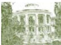
Universidad Federal de Río de Janeiro - Facultad de Medicina

En la segunda mitad del siglo XX, los vientos de una nueva reforma universitaria recorrieron los ámbitos de la educación superior en América Latina. Así también había ocurrido en 1918, cuando en Argentina, el grito de Córdoba dio el aviso reformista hacia la nueva educación universitaria. El nuevo ambiente de colonización cultural con la influencia de la corriente pragmática y tecnológica de los norteamericanos, llevó a los ideólogos de la educación latinoamericana a pensar en una educación más auténtica aplicada a la realidad histórica de estos pueblos de “Nuestra América”, unidos por un lazo común de cultura y subdesarrollo. Con estos planteamientos, el ideario educativo y la acción universitaria del educador Darcy Ribeiro, organizador de la Universidad de Brasilia, es de gran trascendencia en la segunda mitad del siglo XX.