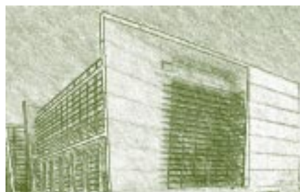
Edificio en Río de Janeiro, Brasil

Para llegar a lo más profundo del conocimiento y comprensión de los numerosos pueblos que han hecho