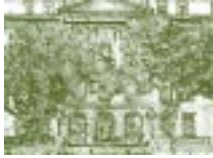
Antigua Escola de Engenharia. Universidade Federal de Rio de Janeiro, Brasil.

cada estudiante sacará el provecho de que es capaz, pero debe ser impartida con la preocupación simultánea de descubrir y cultivar talentos, y de aprovechar al máximo la capacidad real de cada estudiante.