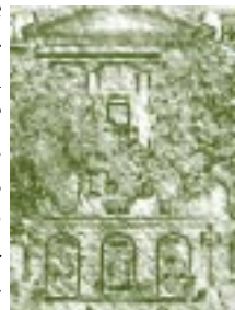
Antigua Escuela de Ingeniería. Universidad Federal de Río de Janeiro, Brasil. Detalle

El Rector Darcy Ribeiro dirigió la Universidad de Brasilia hasta el año 1962, cuando el Presidente Joao Goulart lo nombró Ministro de Cultura del