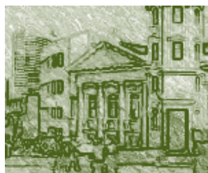
Curitiba. Brasília, Brasil. Detalle.

El educador brasileño Darcy Ribeiro reflexiona sobre las Universidades latinoamericanas: “La verdad es que los cuerpos académicos de las universidades latinoamericanas difunden más frecuentemente una actitud de resignación que explica el atraso como consecuencia de factores naturales inevitables, que una actitud de crítica indagativa”. Las Universidades latinoamericanas por tradición, educan a una juventud reclutada entre las capas más altas de la sociedad, para el ejercicio de las profesiones liberales, con el fin de cumplir actividades de gobierno, de producción y diversas modalidades de servicios indispensables al funcionamiento de la vida social. Son instituciones de educación superior que difunden la ideología de la clase dominante, contribuyendo así a la consolidación del orden vigente. 14