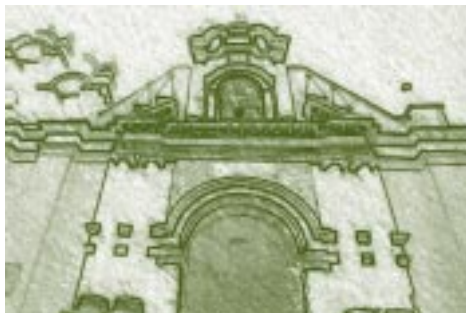
Plaza de armas. Universidad Nacional de Trujillo. Perú.

Las Universidades alemanas ayudaron a formar una ideología nacional y facilitaron instrumentos de superación del atraso relativo en un país que se encontraba frente a las naciones precozmente industrializadas. La Universidad alemana auspició la valorización de la ciencia y la investigación empírico-inductiva. El rasgo dominante de su posición era el nacionalismo y la identificación con la política prusiana de unificación de Alemania. Los ideólogos de la Universidad Alemana fueron Guillermo de Humboldt, Scheimacher, Schellin, Fichte y otros filósofos quienes dieron importancia a la investigación científica y a la libertad académica, con currículos abiertos y dinámicos, y con la libre cátedra. Los grandes catedráticos se convirtieron en los “Maestros” con profesores ayudantes, en posición subalterna. Se crearon los Institutos para realizar la enseñanza y la investigación en forma integral. En la época de las guerras mundiales, las Universidades perdieron gran número de sus mejores científicos y filósofos, por emigración o conscripción de las potencias victoriosas.