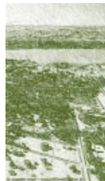
Universidad de Brasilia, Brasil.

El Presidente Joao Goulart intentó resolver los graves problemas sociales y económicos a través de una serie de medidas reformistas, que fueron obstaculizadas por las fuerzas conservadoras y por los militares, quienes lo