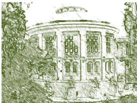
Facultad de Medicina. Universidad Federal de Río de Janeiro, Brasil.

Con la nueva reforma, las Universidades deben estimular la diversidad y crecimiento de las carreras profesionales, científicas y humanísticas; y la apertura de matrículas para la formación de las nuevas generaciones latinoamericanas. Todas las actividades de las Universidades serán públicas, no admitiéndose en ninguna circunstancia, formas secretas o reservadas de acción o de investigación. Se debe defender la autonomía universitaria, "entendida como el derecho de autogobierno, ejercido democráticamente por cuerpos académicos sin imposición externa de los poderes gubernamentales y sin interferencias de ninguna institución extranjera, tanto en la implantación y funcionamiento de sus órganos de deliberación, como en la determinación de su política de enseñanza, de investigación y de extensión."