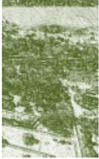
Universidad de Brasília, Brasil. Detalle.

him to raise university educational reforms for Brazil, Uruguay and Venezuela, based on the new tendencies. From his theory of the civilization process he analyzes the situation of the Latin American towns through their ethnology and history, to explain what is happening to the underdeveloped countries or those in process of development. This great theory has led him to interpret the problem of the Latin American Universities, their permanent crisis and their yearnings to make a university reform, in agreement to the current times.