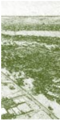
Universidad de Brasilia

su historia en el espacio del continente americano, es indispensable estudiar las etapas de desarrollo en los últimos diez milenios. Con el tiempo y la creación cultural, los hombres fueron conformando sus culturas y civilizaciones, que deben ser analizadas, tanto internamente como en su evolución en el proceso civilizatorio universal. Nuestra América presenta grandes avances culturales en las civilizaciones azteca, maya, inca y otros pueblos que se desarrollaron en diversas regiones del llamado por los europeos “Nuevo Continente”.