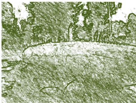
Monolito Ubicado en la UPTC. Detalle.

De tal forma que en este establecimiento, la enseñanza se hizo a base de la comprensión de las diferentes disciplinas científicas; por tanto quedaron proscribas las antiguas prácticas de leer y repetir un texto escolar. Siempre que la materia de estudio lo permitiera, señaló el profesor Sieber, los alumnos debían analizarla por su propia cuenta, valiéndose, según el caso, de experimentos, mediciones, construcciones, comparaciones, o del estudio de fuentes históricas. Allí prestaron sus servicios dos profesores alemanes, Alberto Reichel y Joseph Rulf, el primero formado en idiomas y el segundo en matemáticas, ambos de una gran preparación científica, puesto que dominaban ampliamente las materias de enseñanza y la metodología apropiada a cada una de ellas. La escuela abrió sus puertas por un periodo de un año, luego fue anexada a la Facultad de Educación de la Universidad Nacional en Bogotá.