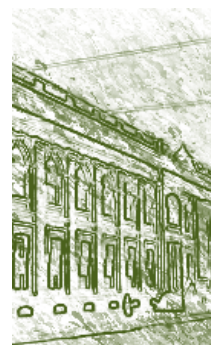
Facultad de Medicina y Ciencias Naturales Universidad Nacional de Colombia. Detalle.