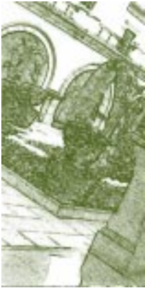
Claustro. Universidad de los Andes, Venezuela. Detalle.

facultades principalmente. El gobierno decretó que se podían admitir extranjeros y más aun solicitarlos si estaban fuera del país, para los ramos de "historia natural" y sus aplicaciones, 13 para las lenguas muertas, menos la latina, y para las lenguas extranjeras.