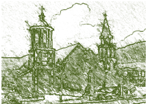
Iglesia de Mérida, Venezuela.