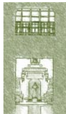
Pasillo de la Rectoría. Universidad de los Andes, Venezuela. Detalle.

Al frente del destino del país, el General Julián Castro encargado de "la organización provisional de la República", y una vez oído el informe de una comisión revisora de los Estatutos de enseñanza, 11 procedió a modificar la instrucción profesional o científica de las universidades. Las cinco facultades se transformaron en seis, a saber: la de Ciencias eclesiásticas, la de Ciencias Políticas, la de Ciencias Médicas, la de Ciencias Naturales, la de Ciencias Físicas, Matemáticas y Filosóficas, y la de Humanidades. 12 Así, se había operado una reforma, al menos desde el punto de vista formal con relación a los contenidos programáticos de las distintas materias de estudio. El 30 de junio de 1858, cuando el señor Jacinto Gutiérrez fuera Ministro de Relaciones exteriores, se promulgó nuevamente un Decreto del Ejecutivo Nacional por el cual se reorganizaban las universidades de Caracas y de Mérida en materia de estudios, cátedras y organización de las