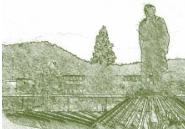
Monumento a Rafael Rangel. Mérida, Venezuela.

Los mensajes de los posteriores jefes de Estado, de 1837 (Andrés Narvarte) de 1838 y 1839 (Carlos Soublette) nada expresan sobre el ramo de Instrucción. Las memorias de los años 1837, 1838 y 1839 presentadas por los Secretarios del Interior y Justicia continúan planteando la necesidad de crear un plan General de Instrucción Pública. La Universidad, los Colegios Nacionales y las Escuelas quedaron relegadas a un plano muy secundario, y no podía ser de otra manera ante la escasez de recursos humanos y materiales (en 1841 el Secretario del Interior y Justicia era Ángel Quintero). El período comprendido entre 1830 y 1848, fue de relativa paz y ello permitió que se le fueran dedicando ciertos recursos a la educación y que se promulgara el Código de 1843. En 1838 se produjo la organización de la Dirección General de Instrucción Pública, creada el 17 de julio de ese año, cuando se designa a Vargas para presidirla, ocupándola hasta 1854 cuando se centraliza nuevamente en el Ministerio de Interior y Justicia el gobierno de la educación y se crea una sección en aquél despacho. En esta fecha el Poder Ejecutivo expide un Decreto que organiza la Dirección Nacional de Instrucción Pública. No