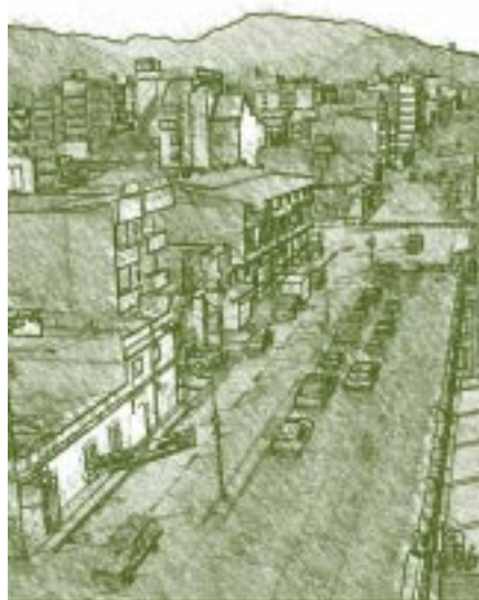
Avenida Tulio Febres Cordero. Mérida, Venezuela.

El 3 de junio de 1897 se promulgó el último Código de Instrucción Pública del siglo XIX, que prácticamente no se aplicó sino en lo relativo a la Educación Primaria, sin duda alguna por los estragos causados por la llamada Revolución restauradora ese año. En este nuevo instrumento legal, respecto de la Universidad, se establecieron modificaciones en la educación superior venezolana, que para la fecha estaba conformada por cinco casas de estu-