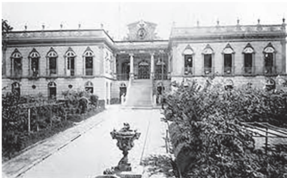
“Imperial Instituto de Meninos Cegos”, construído por el Emperador Don Pedro II, en 1854, Río de Janeiro (Brasil).