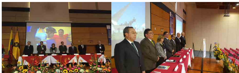
“VI Congreso Internacional sobre historia y prospectiva de las universidades de Europa y América – CIHPUEA. “El futuro de la Universidad Iberoamericana y del Caribe a debate. Desafíos y nuevas perspectivas”