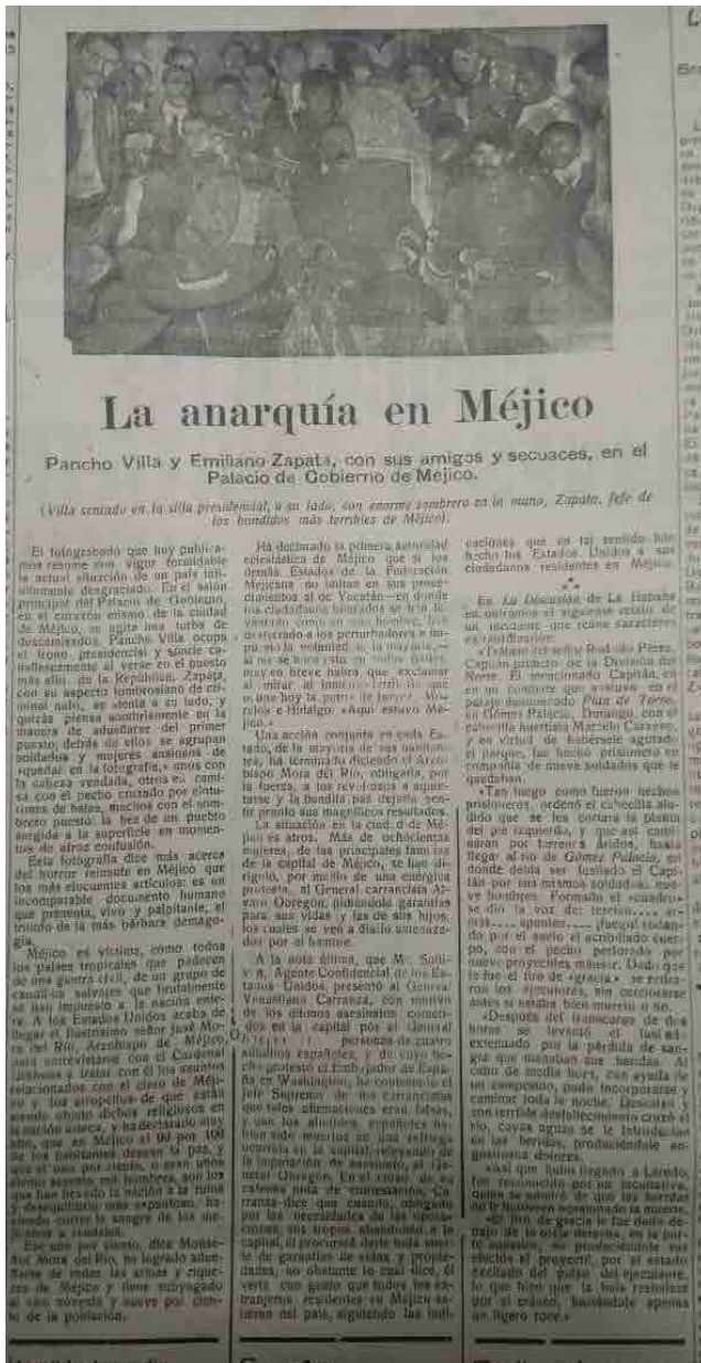
Figura 1. Columna «La anarquía en Méjico. Pancho Villa y Emiliano Zapata con sus amigos y secuaces en el Palacio de Gobierno de Méjico».