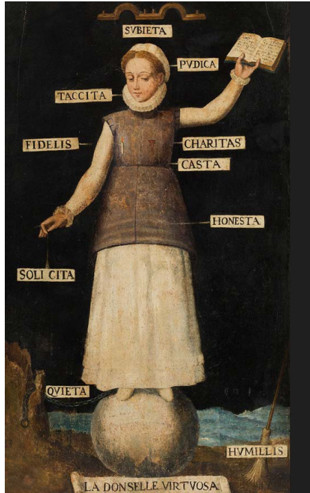
Imagen 1. La donzella virtuosa, Museu Etnologic i de cultures del Mon de Barcelona cass XVI.

la reforma tridentina, tanto en Europa como en la América española 34 . Estos y otros tratados, fueron centrales para el traslado y consolidación de los modelos y roles de género femeninos vigentes en el denominado Nuevo Mundo, labor en que los monasterios femeninos tuvieron un papel destacado.