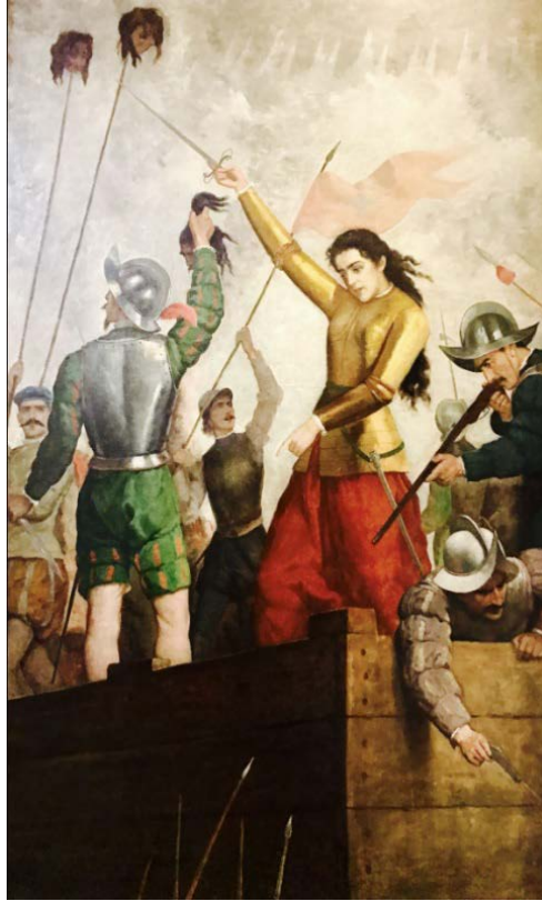
Ilustración 2. Doña Inés de Suárez en la defensa de la ciudad de Santiago. José Mercedes Ortega, 1897. Museo Histórico Nacional de Chile.