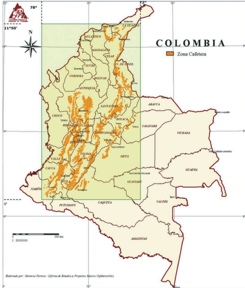
Figura 1. Mapa zonas cafeteras en Colombia