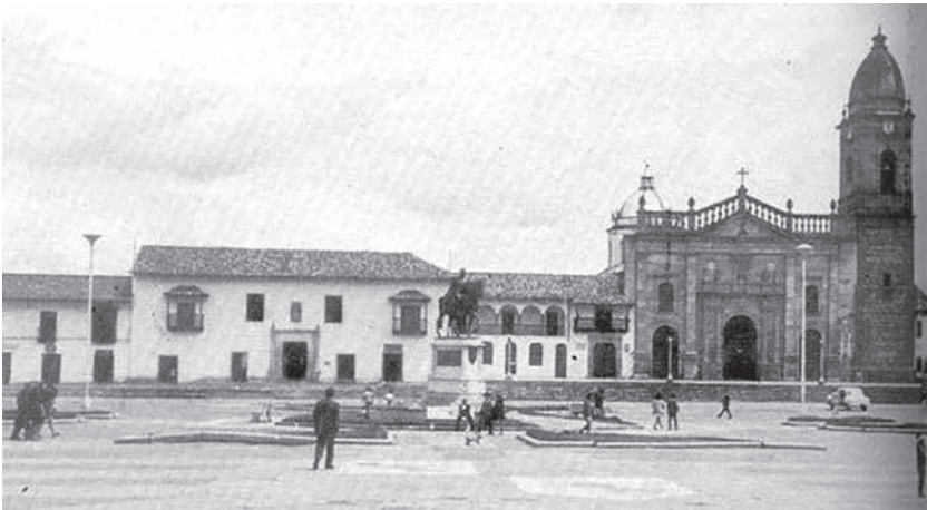
Imagen 1. La Casa del Fundador.

Ítem digo que yo tengo y poseo unas casas principales y con dos solares de la iglesia mayor parroquial de ella y de Pedro Hernández Mercader y por otra parte dos calles reales, la una donde vive Juan de Villanueva con solar de Diego de Patarroyo que antes fue del maestro de escuela don Pedro Gracia Matamoros, y en la otra calle vive Diego Rincon, y las dichas casas principales tienen dos cuartos el uno que sale a la plaza mayor de esta dicha ciudad y el otro cuarto sale frontero del solar de la dicha iglesia mayor y en los dichos dos cuartos hay seis piezas baxas y tengo para hacer corredores en las dichas casas veinticuatro mármoles labrados vazas y capiteles y ocho repisas para hacer los dichos corredores (...) 12 . (Imagen 1).