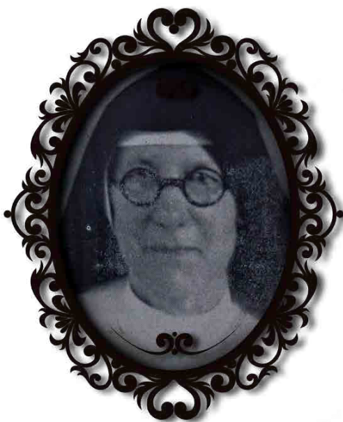
Imagen 1. Sor Honorina Lanfranco, FMA.

En 1901 fue enviada a dirigir la sede del Instituto de Cerdeña, donde tiempo después le solicitó a la superiora ser enviada a América como misionera. En Colombia se desempeñó como rectora del Colegio María Auxiliadora en los municipios de Chía, Guadalupe, Cali, Popayán y Medellín, en esta última ciudad ejerció dicho cargo en dos momentos: de 1915 a 1919 y de 1925 a 1930 10 . El período que va de 1915 a 1930 permitió a Lanfranco la producción de un conjunto de discursos, prácticas y estrategias para hacer del colegio salesiano de Medellín una institución productora de saber que permitió a la juventud femenina educarse para el ejercicio de los roles de esposa, madre y maestra; a la vez que posibilitó la institucionalización de la educación infantil como una práctica de saber, para llevar a cabo la salvación del alma de los párvulos.