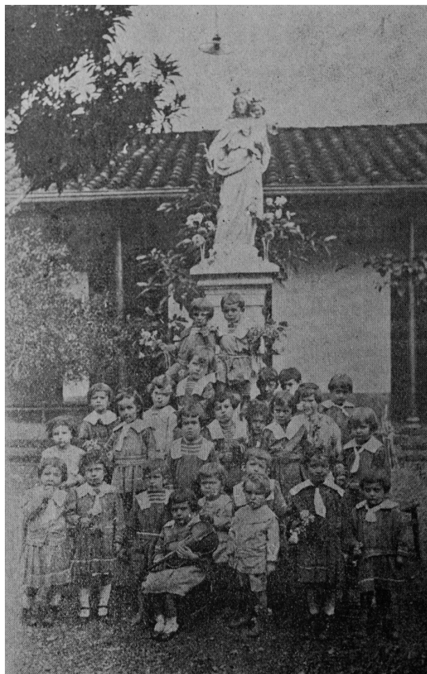
Imagen 2. Grupos de niños del kindergarten n° 2. Colegio María Auxiliadora.

La segunda tensión se produjo con una parte de la sociedad paisa 45 , que no veía con buenos ojos la educación de los párvulos por fuera del hogar: «nuestro primer kínder tuvo que luchar con el ambiente y críticas de las autoridades y de la sociedad de entonces, que no admitían el ingreso de los