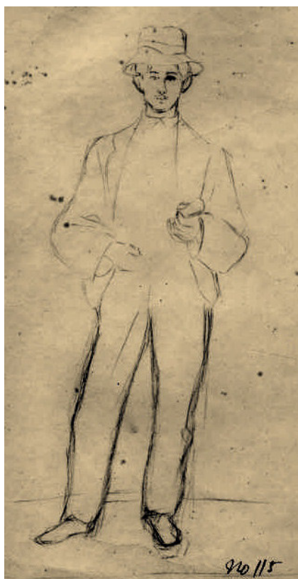
Imagen 3. Antonio Ricaurte de 18 años , Lápiz sobre papel blanco, Passepartout en cartón arte 28x15 cm por José María Espinosa.

Un trabajo anterior de Espinosa, representa al héroe esbozado en apostura juvenil, vestido de civil, de cuerpo entero, con sombrero, boceto a lápiz realizado por Espinosa de un Ricaurte de 18 años de edad y de mirada despreocupada, alejado del joven personaje de referencia militar de la representación heroica. 29