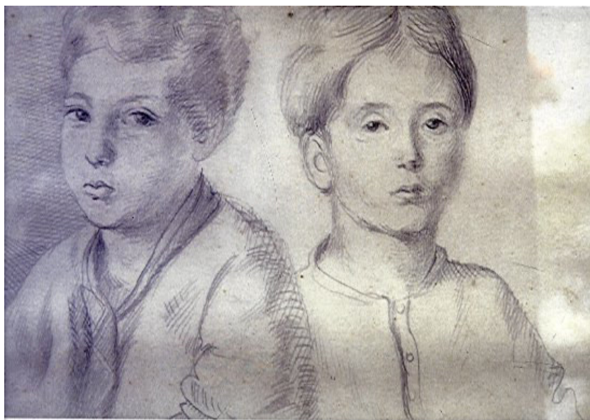
Imagen 6. Atanasio Girardot y Antonio Ricaurte niños, por José María Espinosa. Bogotá, 1850.

Este dibujo fue realizado por Espinosa 36 años después de ocurrido el sacrificio de los dos héroes, en el cerro de Bárbula, uno, y en la casa alta del ingenio de San Mateo, el otro.