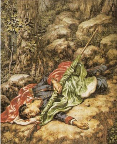
Imagen 11. Juan Escutia (1847) por Jesús Helguera. México D.F.