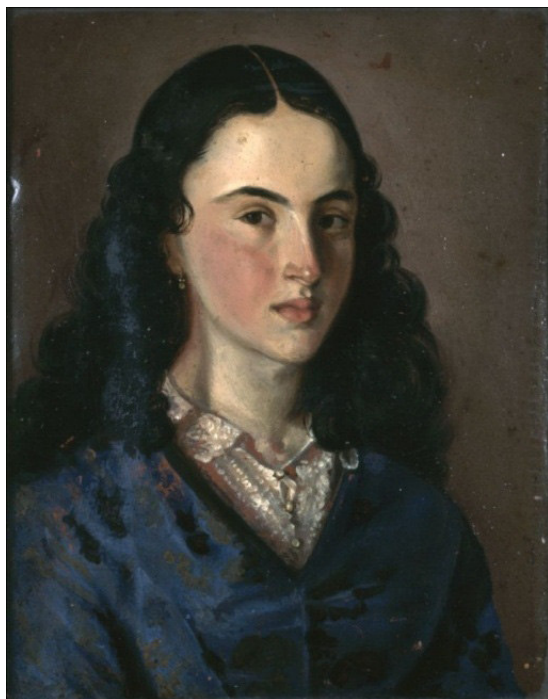
Imagen 8. Retrato de La Pola por José María Espinosa. Bogotá, 1855. Óleo sobre tela 34 x 24,3 cm.