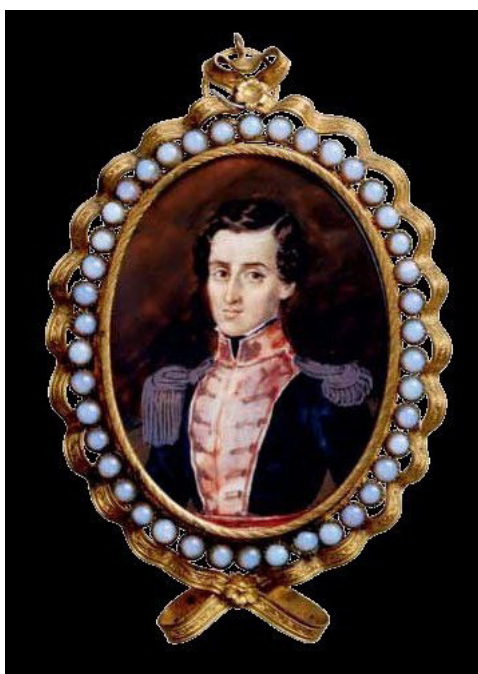
Imagen 2. Ricaurte . Miniatura en Marfil de José María Espinosa. Bogotá, 1830. Fuente: Museo Nacional de Colombia Reg. 570

Esta miniatura fue pintada por José María Espinosa (1796-1883), figura central del arte del siglo XIX en Colombia. Su larga vida, de ochenta y siete años, cubrió casi toda la centuria. De todos los títulos a que se hizo merecedor sólo quiso conservar el de abanderado ; no obstante, la historia del arte lo ha reconocido como