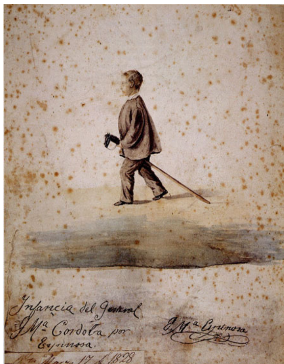
Imagen 4. Infancia del General J. Ma. Córdova por Espinosa. Bogotá, marzo 17 de 1828 actualmente en Medellín.

La serie infantil de Espinosa, empieza con una acuarela que muestra al general José María Córdova en su niñez, en medio de sus juegos habituales, montado en un caballito de palo, año y medio antes de su muerte en El Santuario. Esta obra alegórica, bastante singular, forma parte de la serie que algunos estudiosos de la obra de Espinosa han denominado de los héroes niños y que representa a los futuros próceres en su tierna infancia.