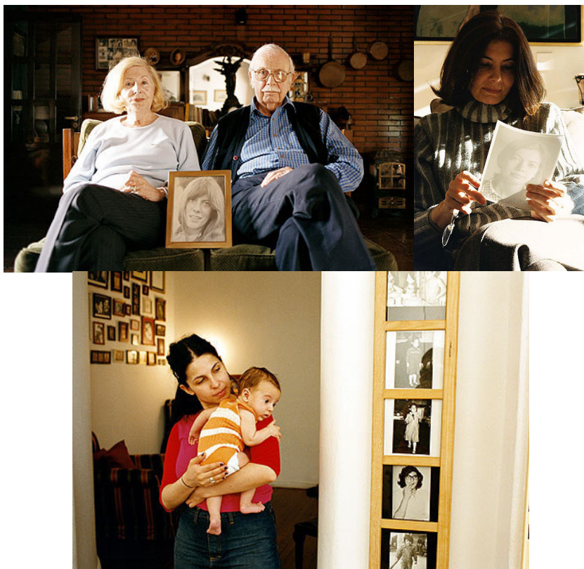
Imagen 5. Inés Ulanovsky, fotografías de la serie Fotos tuyas (2006).

narrativa a los fragmentos supervivientes de un pasado irrecuperable, reconstruyendo a través de sus imágenes lazos familiares e identidades, tanto de los desaparecidos como de sus allegados; continúa, también, en la línea abierta por las prácticas que llamamos de las memorias de la ausencia y que señalábamos antes, consistente en una resistencia necesaria a las memorias heroicas (imagen 5).