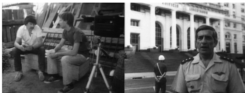
Imagen 7. Carlos Echeverría, fotogramas de Juan, como si nada hubiera sucedido (1987).

“yo di con todos”) (imagen 7). Estos dispositivos de búsqueda a la manera del thriller, que se generalizaban en esos mismos años en el documental internacional mestizando estrategias formales y discursivas del cine y la televisión, 40 tienden a la construcción del sujeto ausente a partir de las poliédricas piezas del puzzle que componen los testimonios (de los familiares y amigos, de los implicados y responsables de la desaparición) y las pistas que guardan los documentos, los objetos o los lugares. Pero a diferencia de las derivas posmodernas de otras manifestaciones afines, Echeverría y Buch no se pierden entre los laberintos que diluyen el objeto y la razón de la búsqueda, como queda claramente señalado en la conclusión. Aunque los sobrecogedores resultados de la investigación se desvelen antes en los silencios, los titubeos y los tartamudeos, las negaciones y las respuestas airadas que en la información sustantiva de los testimonios: su condición de documento se afirma precisamente en esas instancias del silencio, de la ausencia y de la desmemoria de sujetos y lugares. Los rasgos formales altamente contemporáneos del film (la puesta en evidencia del dispositivo a través de desvelar el proceso de producción del film con la preparación