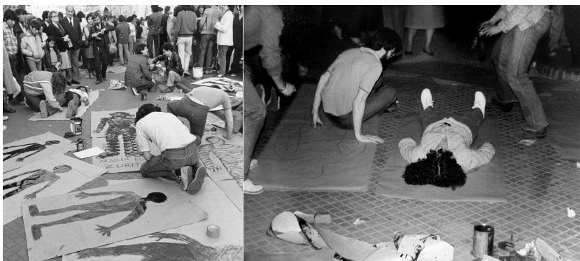
Imagen 2. Fotografías del Siluetazo , 21 de septiembre de 1983.

la individualidad de las figuras y, con ella, la comprensión del terror. El vacío, limitado por el contorno de los cuerpos, expresaba la ausencia/presencia de los desaparecidos, al mismo tiempo que la interrupción del sentido y tiempo históricos como consecuencia de un acto de violencia de tal magnitud. (imagen 2).