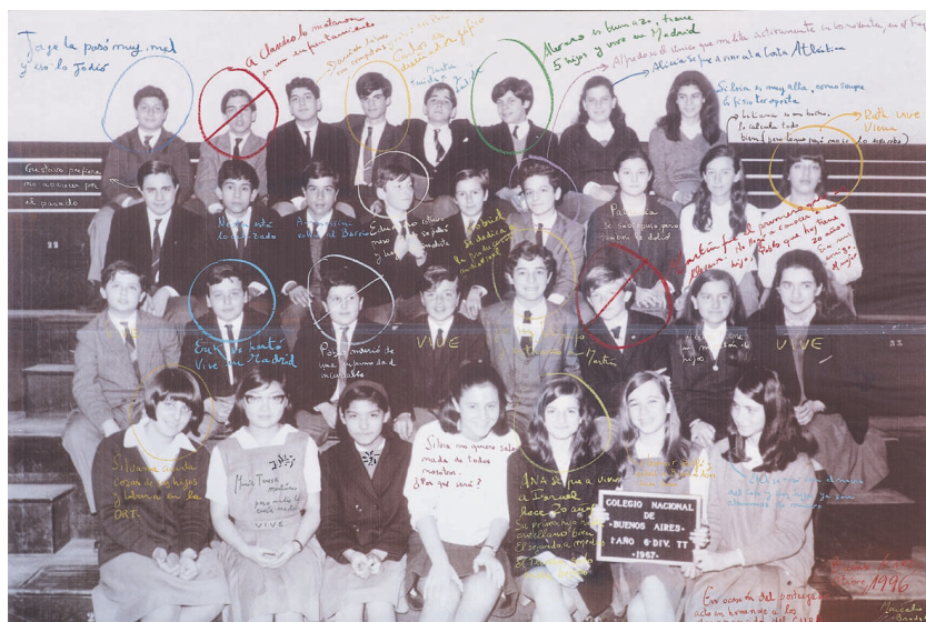
Imagen 1. Marcelo Brodsky, Buena Memoria (fotografía principal), 1997.

Comencemos con esta imagen (imagen1), la pieza principal del ensayo fotográfico Buena Memoria que el artista Marcelo Brodsky expuso por primera vez en 1997. Ésta, una fotografía tomada en 1967 de los estudiantes de la sexta división del primer año del Colegio Nacional de Buenos Aires, ha sido intervenida con múltiples anotaciones en distintos colores. Algunos rostros están tachados. Las inscripciones indican desapariciones,