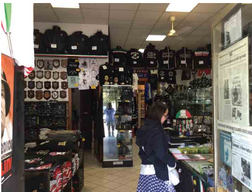
Imagen: Tienda de «souvenirs» nazifascistas en Predappio.