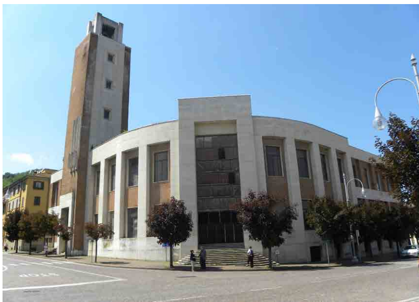
Imagen: Casa del Fascio en Predappio. Edificio donde se debe ubicar el nuevo Museo Memorial sobre el Fascismo.

Predappio está pues en medio de la polémica, algunos comienzan a defender que se haga derruir la casa del Fascio y se olvide el proyecto. Tal vez, hacerlo sería dar la razón a aquellos que ya tienen su lugar físico y simbólico de peregrinación en Predappio y se les concedería la exclusiva. Tienen la casa museo y tienen el panteón privado. Quizás que el resto de ciudadanos podamos disponer pronto de un espacio de aprendizaje, reflexión y análisis crítico de lo que fue uno de los orígenes de las catástrofes del siglo XX, pero la política y sus derivas sentenciarán, una vez más, a ese lugar a la polémica constante.