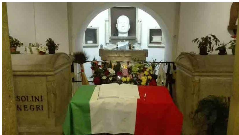
Imagen: Cripta y tumba de Benito Mussolini y su familia.