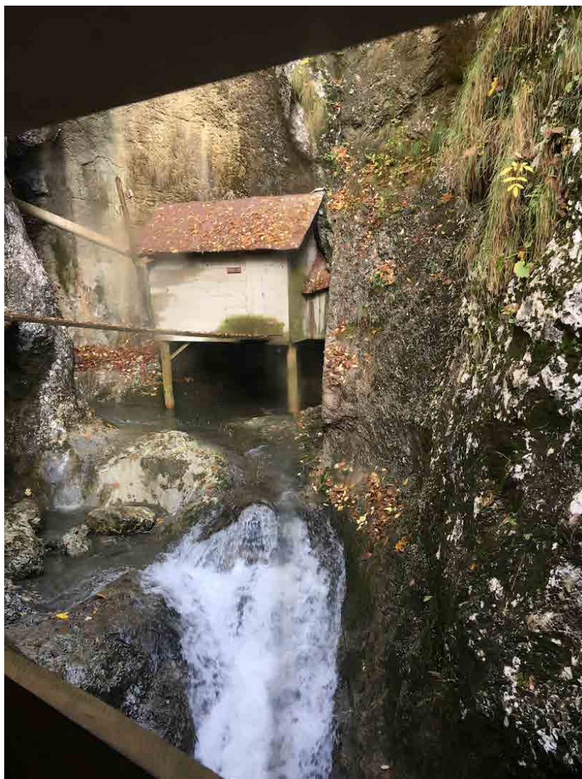
Imagen: Memorial-Museo del Hospital de Partisanos de Franja, Eslovenia.

a partir de 2007, cuando una riada dañó gran parte de las barracas originales y los accesos. Fue la participación y la iniciativa de los vecinos quienes voluntariamente iniciaron su recuperación, restauración y recreación museográfica como patrimonio, natural, local y memorial.