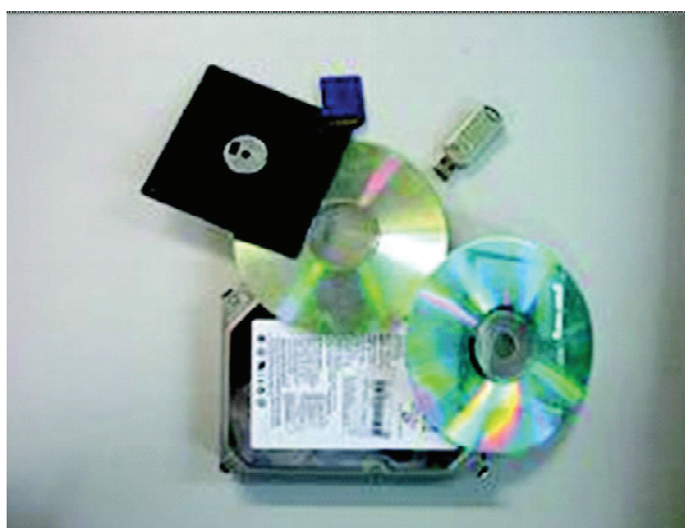
Figura 3. Diferentes dispositivos de almacenamiento de información digital [14]

ocasiones, a que se pierda gran cantidad de información. La obsolescencia de medios y la posibilidad de perder la información digital almacenada son temas de interés antes para estudiar, ya que la presión de la industria con constantes lanzamientos de nuevos formatos, así como el costo de traspaso de la información al nuevo medio, pueden hacer que gran parte del conocimiento adquirido a lo largo de los siglos, pueda perderse por el camino [9]. «El patrimonio digital del mundo corre el peligro de perderse para la posteridad. Contribuyen a ello, entre otros factores, la rápida obsolescencia de los equipos y programas informáticos que le dan vida, las incertidumbres existentes en torno a los recursos, la responsabilidad y los métodos para su mantenimiento y conservación, y la falta de legislación que ampare estos procesos» [13].