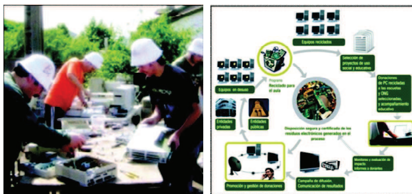
Figura 2. Reutilización de equipos de cómputo [10, 11]