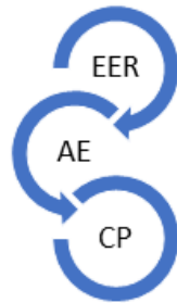
Fig. 1. Modelo CEPAER.

El modelo se conjuga, como aparece a continuación, a partir de las categorías teóricas formuladas representadas de forma abstracta y dinámica a través del conjunto de interacciones que conceptual y metodológicamente se delimitan en torno al objeto de estudio: las energías renovables.