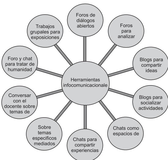
Figura 2- Herramientas infocomunicacionales utilizadas en las prácticas pedagógicas para potenciar la formación de lo humano.

estudiantes, la cual está caracterizada por prácticas visibles, centrada en contenidos explícitos, de orden secuencial, enfoca en diálogos precisos bajo modelos de conversación por contenidos. Con base en esto, las categorías son: