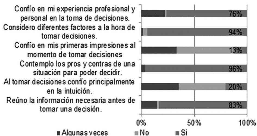
Figura 2. Factores que tienen en cuenta los gerentes en el momento de decidir.

hora de la TD, como lo indica la cifra del 94%. Así mismo, el 76% de los gerentes reúne la información necesaria antes de la TD, y admiten confiar en la experiencia profesional y personal, lo que indica un estilo de decisión racional e intuitivo. Sin embargo, un 20% y 13%, manifestaron no guiarse en la TD por la razón o la intuición, respectivamente, ver figura 2.