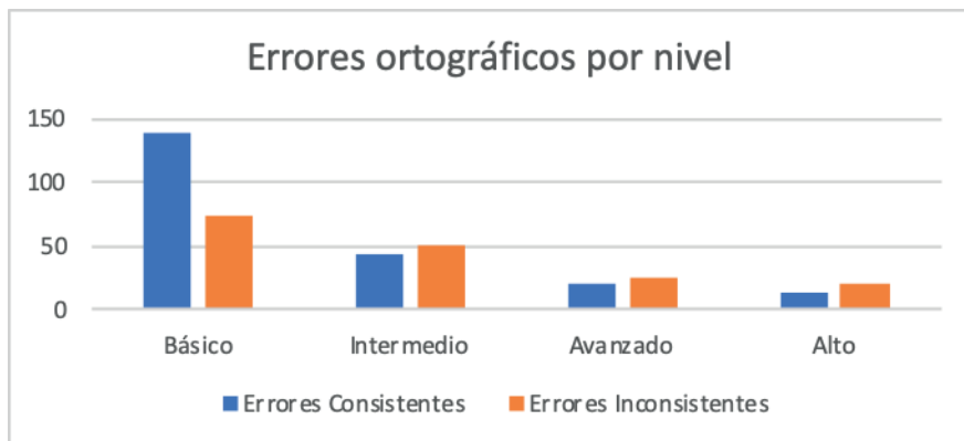
Figura 1. Errores ortográficos por nivel