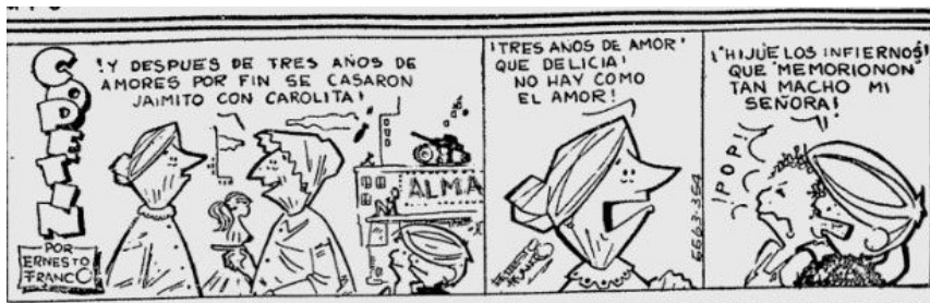
Figura 1. Copetín, El Tiempo , (tira 630611), Biblioteca Nacional de Colombia.

Lo mismo sucede con farrononón , jurgonón , grandotote y sedonón que expresan el gran tamaño de un objeto (la negrilla es nuestra y la transcripción es fiel a lo publicado en las redes sociales):