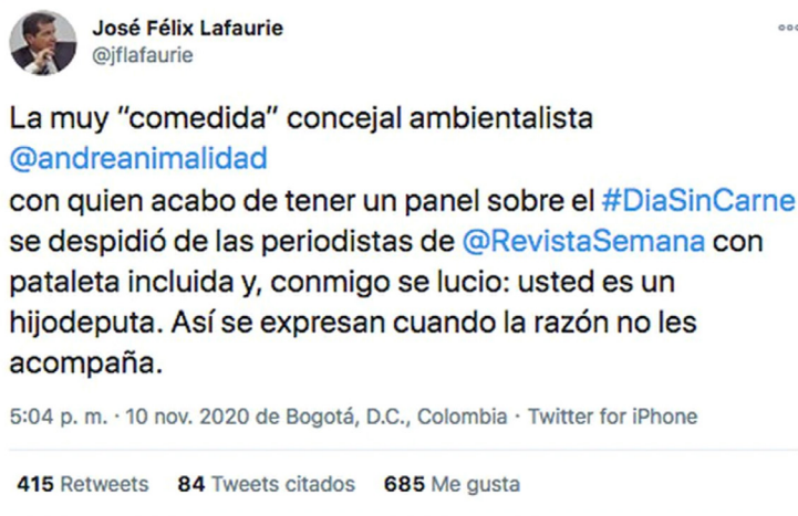
Figura 4. Pantallazo del trino del presidente de Fedegán, 10 de noviembre de 2020

El ecosistema hipermediático les permite a ambos participantes seguir en Twitter la retransmisión de la interacción y comentarla. La concejala ve, mientras habla, los tuits de su contraparte, como lo refiere al final desde 0:52 y hasta despedirse del programa. El tuit al que se refiere es el siguiente (Figura 4):