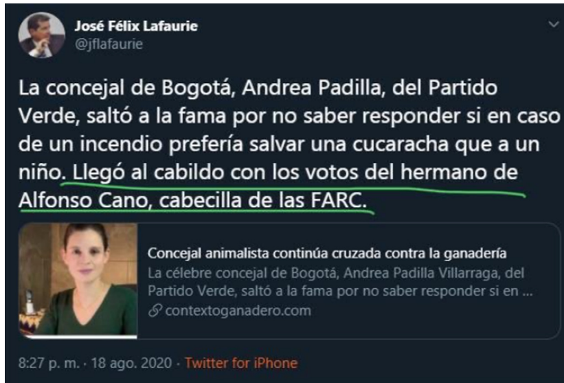
Figura 1. Pantallazo del trino del presidente de Fedegán, 18 de agosto de 2020

A través de Twitter, el 18 de agosto de 2020, el presidente de Fedegán acusó a la representante política de haber sido elegida al Concejo de Bogotá por tener vínculos estrechos con la guerrilla de las FARC (Figura 1).