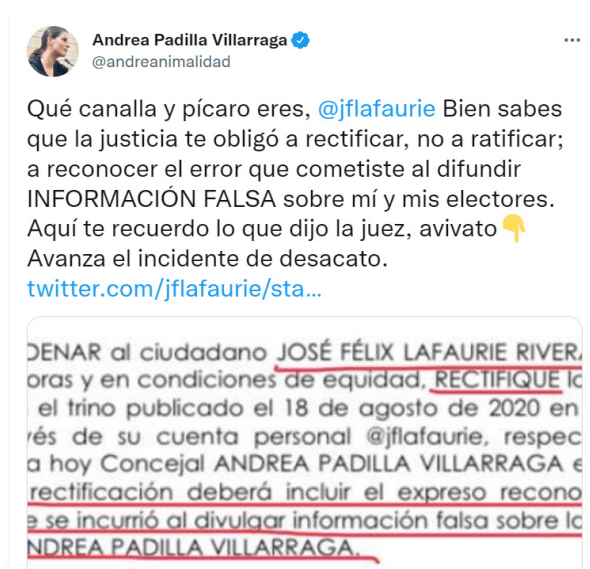
Figura 3. Pantallazo del trino de la concejala bogotana, septiembre 22 de 2020

La sentencia judicial ordena que “la rectificación deberá incluir el expreso reconocimiento del error en el que se incurrió al divulgar información falsa sobre la elección de la concejal”, como es citado por la propia representante, en su reacción a la publicación anterior (Figura 3):