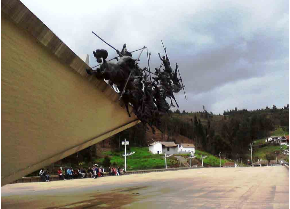
Pantano de Vargas, Boyacá

LENGUAJE Y COMUNICACIÓN LANGUAGE AND COMMUNICATION LANGUE ET COMMUNICATION LINGUAGEM E COMUNICAÇÃO