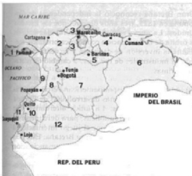
Mapa 1: Provincia de Tunja.

Santa Rosa de Viterbo, hacía parte de la Provincia de Tunja del Nuevo Reino de Granada, ubicado al norte de su capital, (ver mapa 1). Su nombre de origen italiano, marcado netamente por las creencias religiosas, hace honor a la Niña Santa, perteneciente a la Tercera Orden de San Francisco de Asís, que nació en la ciudad de Viterbo (Italia). Lo lleva desde su erección como Parroquia, el 28 de abril de 1690 por el Cabildo Metropolitano, título que fue ratificado por el Gobernador del Nuevo Reino de Granada, Maestre de Campo Gil de Cabrera y Dávalos. En la actualidad este municipio es conocido como “La tierra de los Gochos” 2 , este sobrenombre no se sabe exactamente el por qué lo recibió, a veces es asociado a un período en el cual, la iglesia solo tenía una torre, otra historia cuenta que a finales de 1800 un campesino vio a un burro que había perdido una oreja, y en voz alta dijo “Mire ese gocho, este es el pueblo de los Gochos”. 3