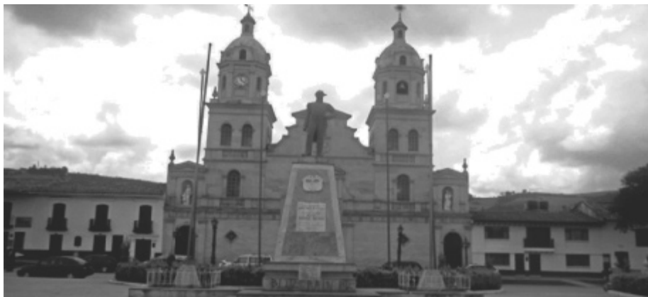
Fotografía I: Parque Principal de Santa Rosa. Monumento al General Rafael Reyes.

fue escenario de las luchas entre el cacique Tundama y Gonzalo Jiménez de Quesada 4 , producto de las cuales se dio el mestizaje, la implantación del control político, económico, social y cultural de los españoles.