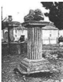
Fotografía 3. Imagen del Meteorito, en Santa Rosa de Viterbo 1906 13

Aerolito pesa quince quintales. Lo halló Cecilia Corredor en la colina de Tocavita, en el año de mil ochocientos diez, colocado aquí por orden de la Municipalidad el 8 de Septiembre de mil ochocientos setenta y tres 12 .