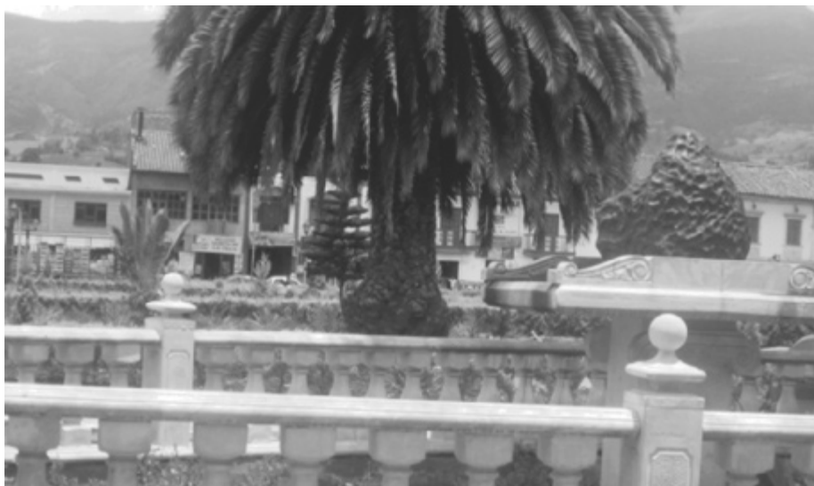
Fotografía 2: Parque Principal de Santa Rosa. Parte de los Aerolitos de 1810.

El año de 1810, para los santarroseños no solo es el año en el cual se da la primera manifestación formal de la independencia de los neogranadinos de la corona Española, este año comenzó para ellos con un suceso especial y