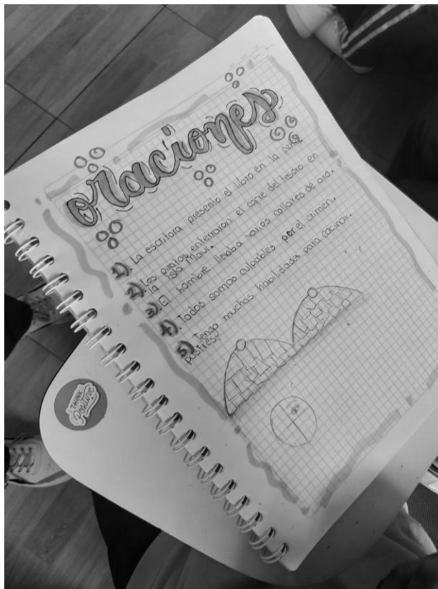
Figura 2. Respuesta de un estudiante

Por otro lado, en cuanto a la organización de oraciones en párrafos y subrayar ideas del capítulo, inicialmente resaltaron enunciados extensos, pero luego en la realización de los esquemas, se percibió que lograron ser concisos y coherentes con la información.