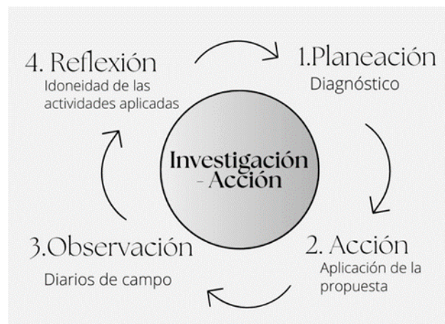
Figura 2. Investigación Acción

Partiendo por la afirmación de que la educación es una ciencia de carácter social, esta investigación trabajó bajo el enfoque cualitativo, puesto que no busca una precisión numérica (Mireles, 2015). En esta misma línea, se tuvo en cuenta el paso a paso propuesto por Lewin (1946) citado por Latorre (2003) para la Investigación Acción como diseño metodológico, el cual está compuesto por cuatro fases que son: planeación, acción, observación y reflexión, así como se muestra en la Figura 2.