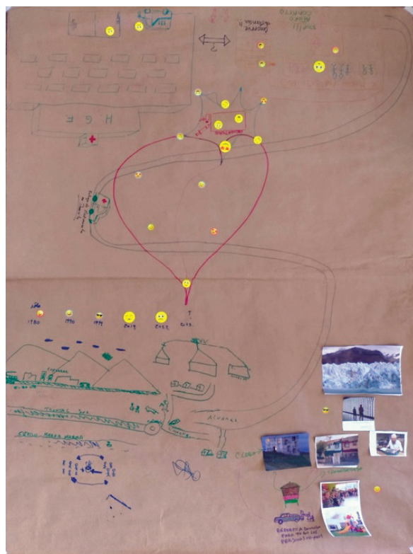
FIGURA 2. Cartografía social elaborada en la Jornada Cartográfica Expresiva del barrio de Chorrillos Fotografía de cartografía elaborada en la jornada realizada en relación con el barrio de Chorrillos.

si bien no da abasto para atender a todo. En la Figura 2 se presenta la cartografía social elaborada en la Jornada Cartográfica Expresiva del barrio de Chorrillos.