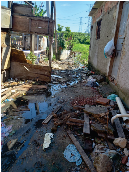
FIGURA 4. Esgoto “à céu aberto” em viela da comunidade da favelinha no Bairro Parque Analândia.