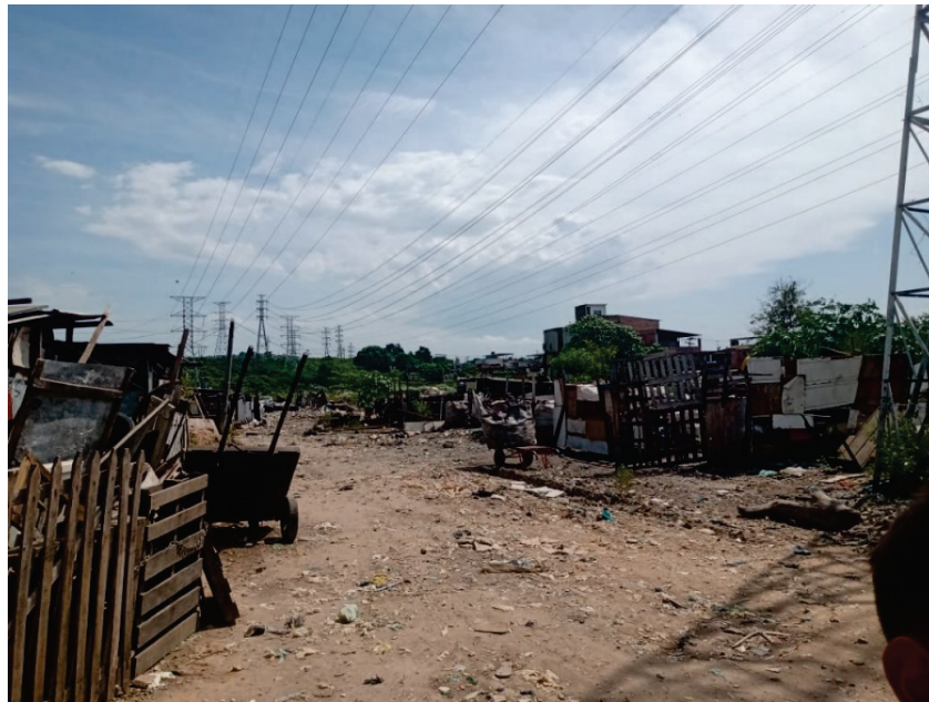
FIGURA 5. Área de cata-lixo dentro da comunidade da favelinha.