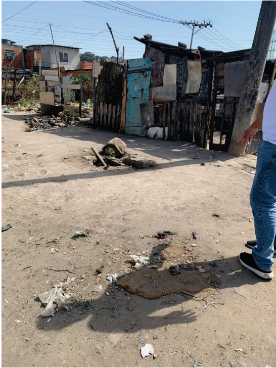
FIGURA 3. Perfil das habitações da população mais fragilizadas na comunidade da favelinha no Bairro Parque Analândia.