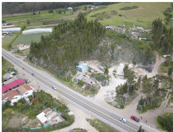
FIGURA 1. Municipio de Nobsa, Boyacá, Colombia: se señala el lugar de residencia de ocurrencia del relato de la entrevista

Ahora bien, como un acto reivindicativo, en este artículo se busca realizar una aproximación geográfica a los feminicidios ocurridos en el departamento de Boyacá, Colombia, entre 2017 y 2021, como resultado de investigación de mi proceso de formación como magíster en Geografía de la Universidad Pedagógica y Tecnológica de Colombia en convenio con el Instituto Agustín Codazzi, a partir de la historia de vida de una mujer habitante de la región, quien es la madre de una niña víctima de un feminicidio ocurrido en una vereda del municipio de Nobsa, ubicado en Boyacá (Figura 1). A través de su historia y de contrastar datos epidemiológicos del departamento, se intenta explorar los hechos de violencias contra las niñas y las mujeres en los espacios físicos y simbólicos de Boyacá.