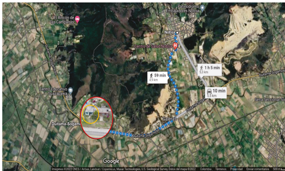
FIGURA 2. Ubicación geográfica de la vivienda con relación al municipio de Nobsa

Como se observa en la Figura 2, la ubicación geográfica de la vivienda de ocurrencia de los hechos relatados en la historia de vida está en la zona rural del municipio de Nobsa y tiene una relativa cercanía al centro poblado. Así mismo, se observa que el paisaje que rodea la vivienda hace referencia a vivienda tipo campesina, en cuyos alrededores se desarrolla la producción mineral de cal.