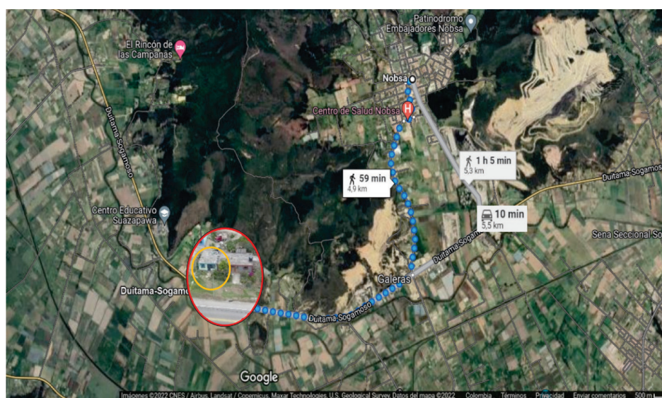
FIGURA 2. Ubicación geográfica de la vivienda con relación al municipio de Nobsa

Como se observa en la Figura 2, la ubicación geográfica de la vivienda de ocurrencia de los hechos relatados en la historia de vida está en la zona rural del municipio de Nobsa y tiene una relativa cercanía al centro poblado. Así mismo, se observa que el paisaje que rodea la vivienda hace referencia a vivienda tipo campesina, en cuyos alrededores se desarrolla la producción mineral de cal.